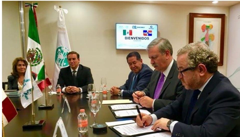
Momento de la firma del MOU