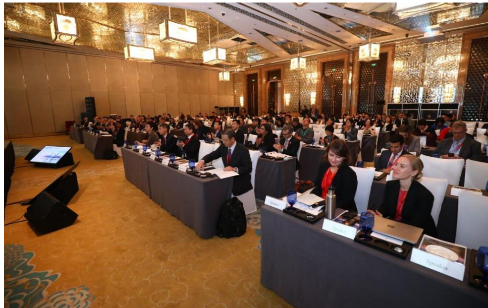
Asistentes al Sexto congreso Anual de Banca Verde