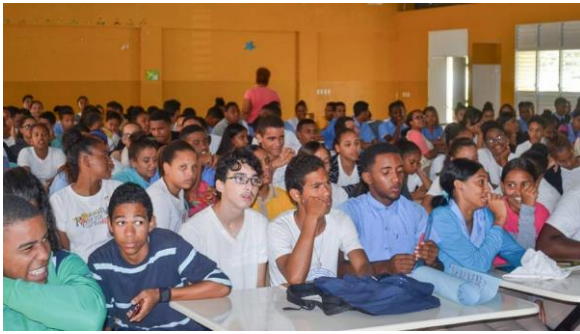
Ilustración 15 Conversatorio Deporte Igual a Juventud en Santiago.