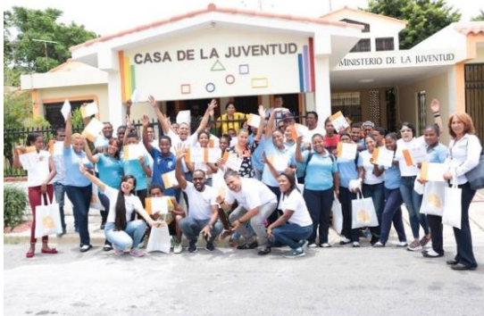
Ilustración 29 Taller sobre Control y Prevención del VIH y Sida en las Casas de la Juventud en Barahona.