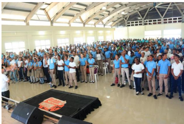
Ilustración 5 Hablemos de Todo RD en Barahona.