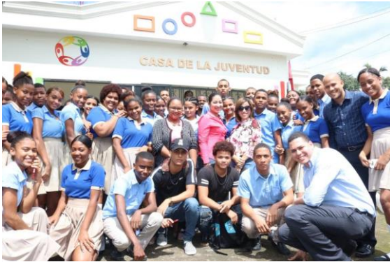
Ilustración 13 Charla el arte de la comunicación, Casas de la Juventud en Pedro Brand.