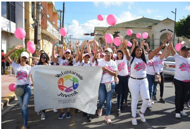
Ilustración 27 Caminata de la lucha contra el cáncer de mama, en San Francisco de Macorís