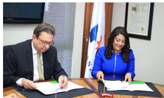
Ilustración 10 Firma de acuerdo entre el Ministerio de la Juventud y la Universidad Nacional Pedro Henríquez Ureña