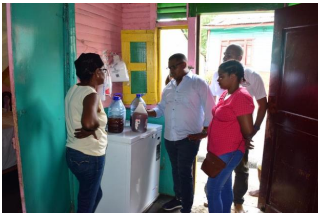
Ilustración 35 Visita a los productores de la Casa Pensión de Yamasá y Cevico en el proyecto Sabor a Juventud