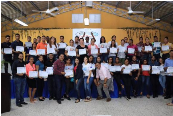
Ilustración 9 Jornada de Liderazgo Socio Político en Valverde.