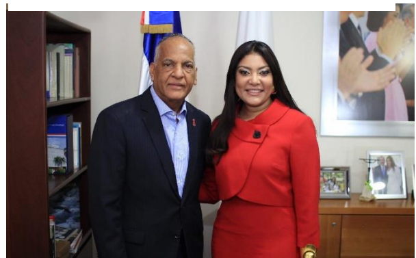
Ilustración 8 Firma de acuerdo entre el Ministerio de la Juventud (MJ) y el Consejo Nacional para la Prevención del VIH y el SIDA (Conavihsida).