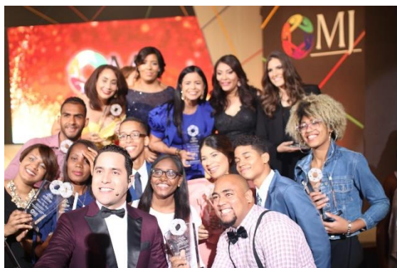
Ilustración 41 Ganadores del Premio Nacional de la Juventud 2018