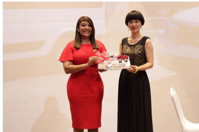
Ilustración 38 Ministra Robiamny Balcácer participa en recepción para celebrar el establecimiento de las relaciones diplomáticas entre la República Popular China y la República Dominicana