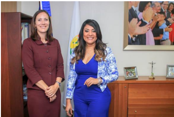
Ilustración 37 Ministra Robiamny Balcácer recibe visita de cortesía de Shauna Hemingway, embajadora de Canadá en la República Dominicana