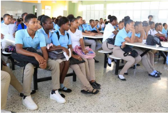
Ilustración 21 Charla de Prevención del cáncer de mama, en la Victoria, Santo Domingo