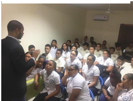
Ilustración 24 Taller Marca Personal en la era digital en la Casa de la Juventud de la Vega