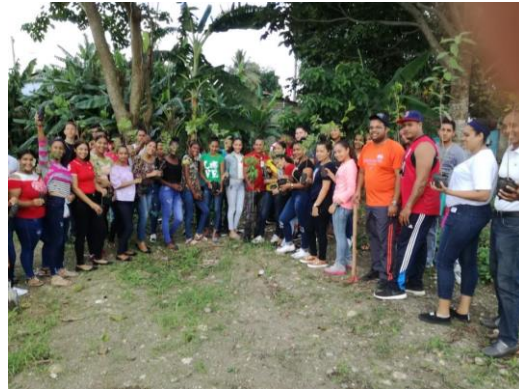
Ilustración 6 Jornada de reforestación en Tenares, Hermanas Mirabal