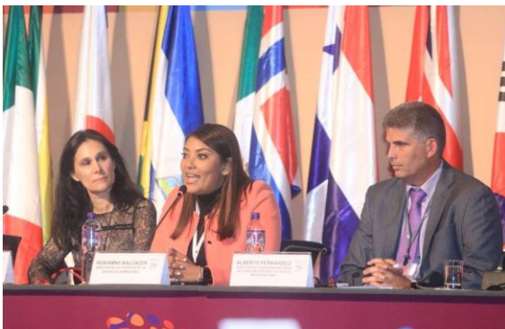
Ilustración 23 Participación de la Ministra Robiamny Balcácer en el panel sobre los retos pendientes para la atención a las demandas de niños, niñas, adolescentes y jóvenes