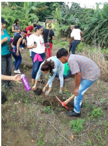
Ilustración 11 Voluntario del Mj participando en la jornada de reforestación en Hermanas Mirabal