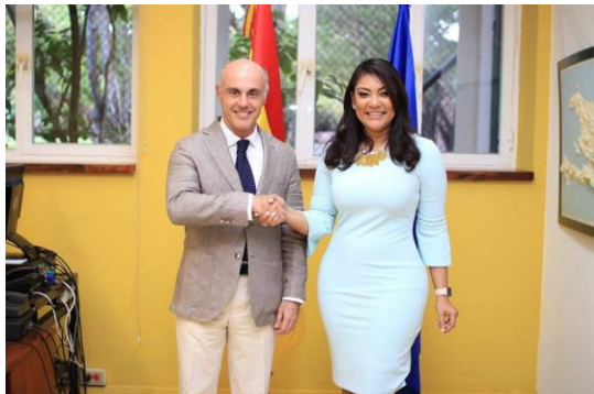
Ilustración 39 Reunión con Alejandro Abellán García, embajador de España en la República Dominicana,