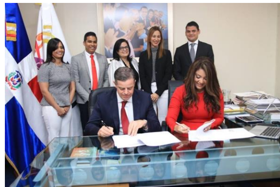
Ilustración 18 Firma de acuerdo con Nestlé para desarrollar el programa "Camino a tu Primera Experiencia Laboral"