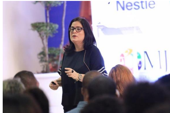
Ilustración 20 Ilustración 13 Charla Camino a tu primera experiencia Laboral en San Cristóbal.