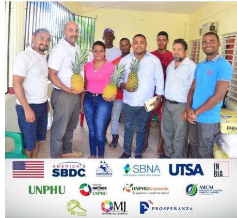
Ilustración 26 Visita a los productores de la Casa Pensión de Yamasá y Cevico en el proyecto Sabor a Juventud