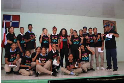
Ilustración 7 Lanzamiento del Programa TU NO TA PA ESO, en azua.