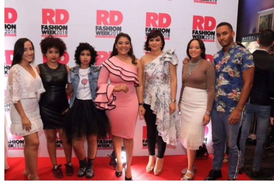
Ilustración 1 Décima edición del RD Fashion Week