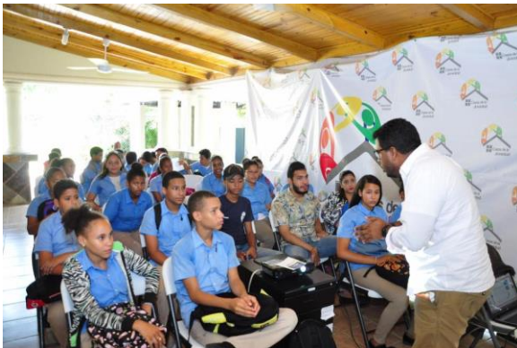
Ilustración 17 Taller de la Ley de la Juventud en la Casa de la Juventud en San Francisco de Macorís.