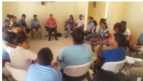
Ilustración 3 Charla conoce tus derecho y deberes, Casa de la Juventud de Azua.