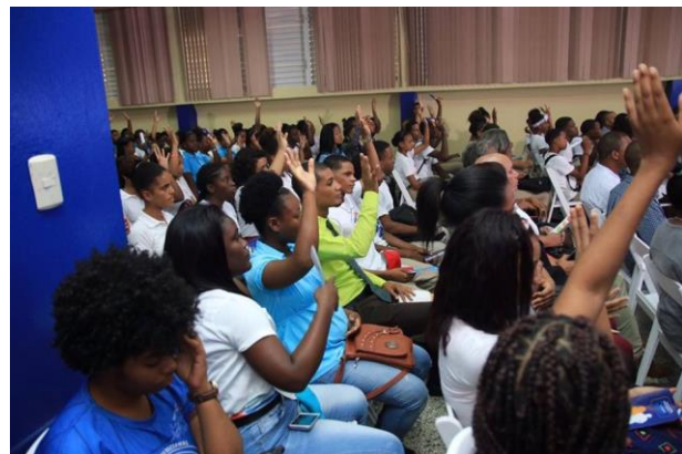
Ilustración 4 Charla Camino a tu primera experiencia Laboral en San Cristóbal.