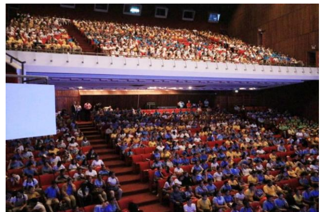
Ilustración 6 Hablemos de Todo RD en Santiago.