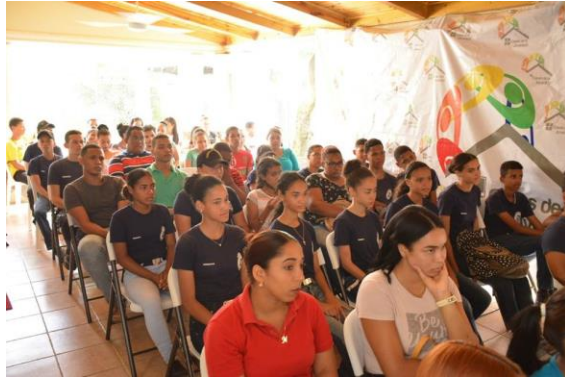
Ilustración 1 Taller sobre Género y Juventud en la Casa de la Juventud de San Francisco de Macorís.