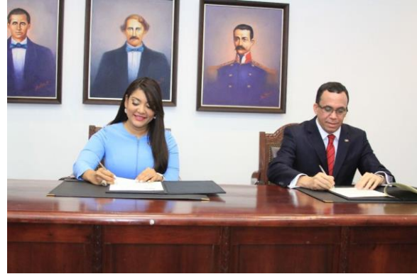
Ilustración 32 Acuerdo entre el Ministerio de la Juventud y el de Educación para el desarrollo de bachilleres