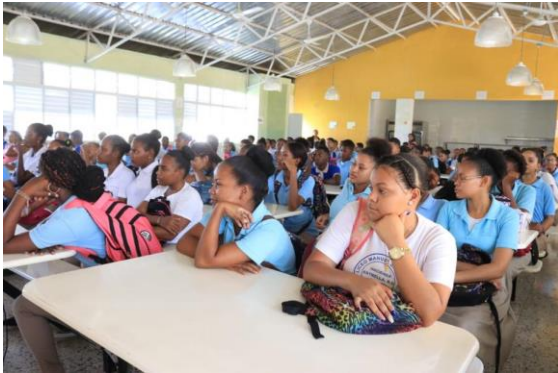
Ilustración 19 Charla de Prevención del Cáncer de Mama en Santo Domingo Norte.