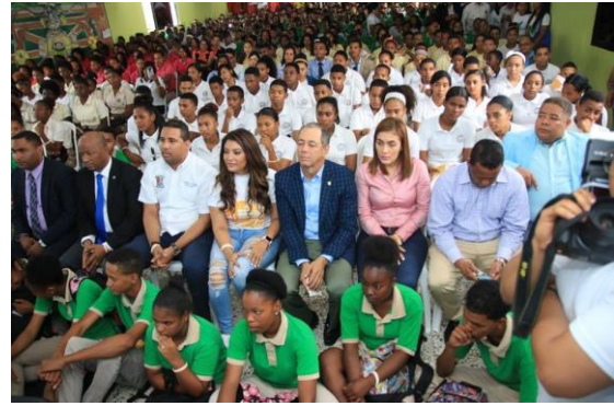
Ilustración 14 Hablemos de Todo RD en Hato Mayor.