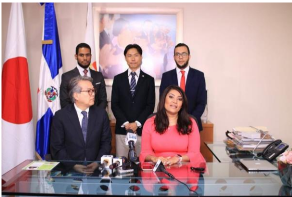
Ilustración 33 Ministerio de la Juventud y Embajada de Japón en el país anuncian convocatoria para programa de intercambio y desarrollo cultural.