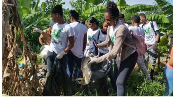
Ilustración 2 jornada de reforestación en Hermanas Mirabal