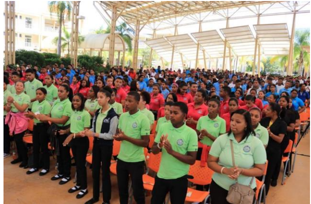
Ilustración 4 Hablemos de Todo RD, San Juan de la Maguana.