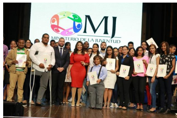
Ilustración 9 Entrega de becas de la Convocatoria Nacional de Innovación y Tecnología.