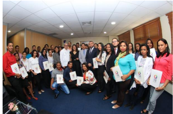
Ilustración 34 Entrega de Becas a jóvenes de Montecristi.