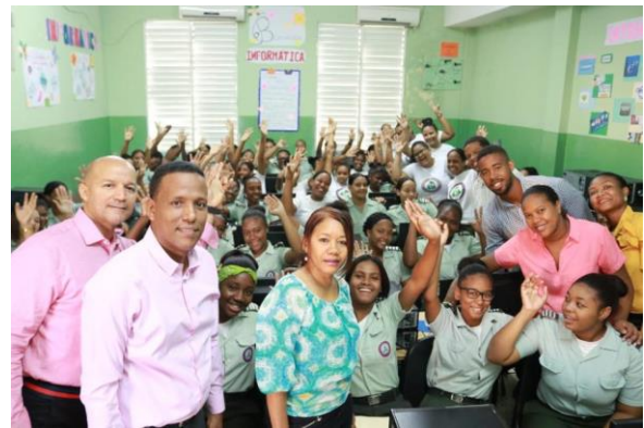
Ilustración 5 Charla de Prevención del Cáncer de Mama en Santo Domingo Norte