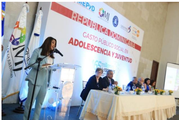
Ilustración 3 Presentación del Estudio para la cuantificación del Gasto Público Social dirigido a la Adolescencia y Juventud (GPSAJ) en República Dominicana 2012-2016”