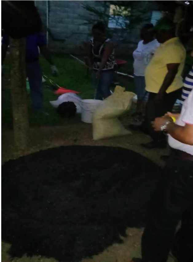
Elaboración de Abono Orgánico Proyecto Huerto Casero en San Francisco de Macorís.