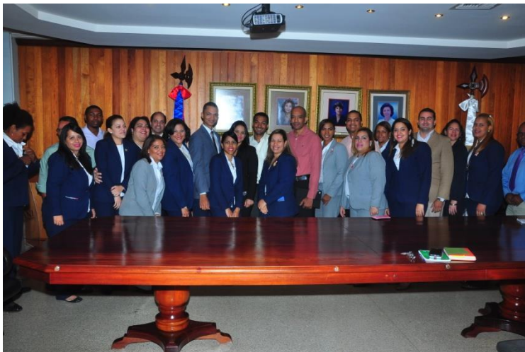
Charla sobre Ética, Transparencia y Acceso a la Información, impartida por representantes de la Dirección General de Ética e Integridad Gubernamental (DIGEIG) a directores y encargados de departamento del CONANI. 13 de octubre 2015.