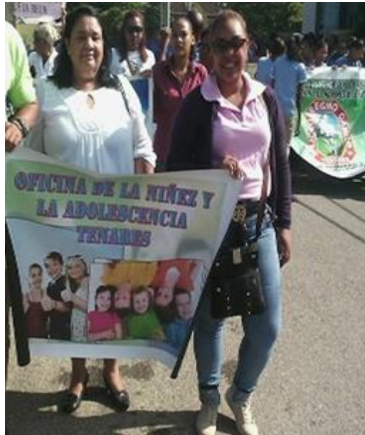
Caminata por los derechos de la niñez