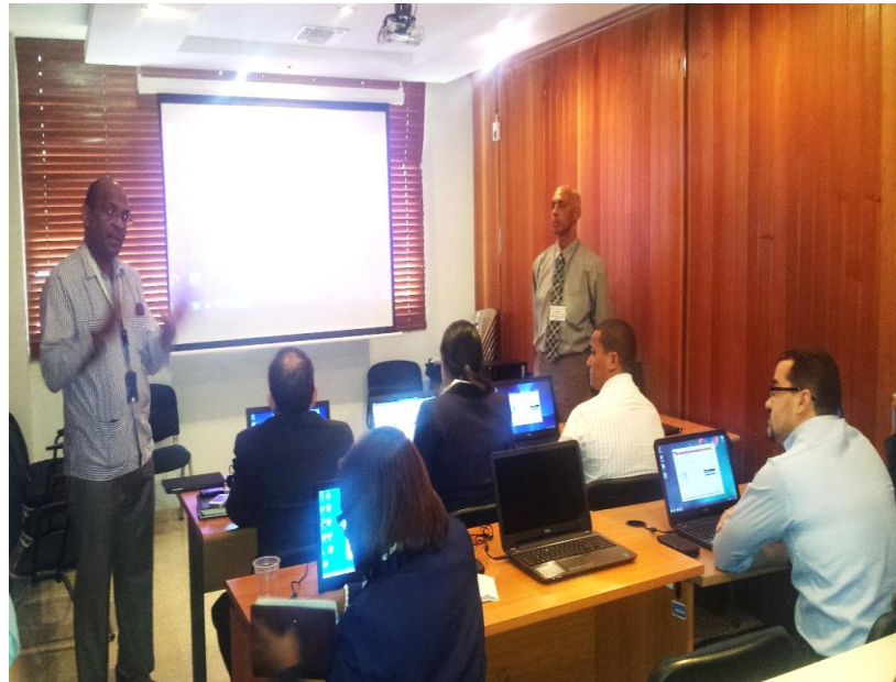
Participaron representantes de departamentos de Gestión Territorial, Jurídica, Supervisión Técnica OG y ONGs, Adopciones, Tecnología de la Información, entre otros.

La sección de Sistema de Información de Infancia y Adolescencia junto al Departamento de Políticas Públicas con fondos de la Universidad Ryerson de Canadá, impartió el 14 y 15 de mayo del 2015 el primer taller de capacitación sobre uso y manejo del Sistema de Indicadores e Información Estadística sobre la Niñez y la Adolescencia en la Republica Dominicana, en el cual participaron representantes de departamentos de Gestión Territorial, Jurídica, Supervisión Técnica OG y ONGs, Adopciones, Tecnología de la Información, entre otros.