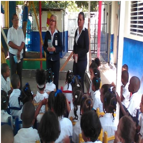
Colegio Fraymi Dajabón, municipio