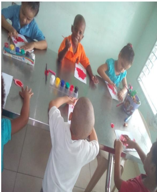
Primer día de clases