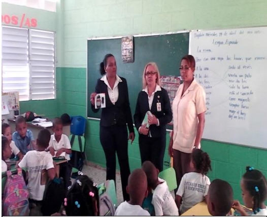
Escuela Fe y Alegría, Centro de la Ciudad de Dajabón