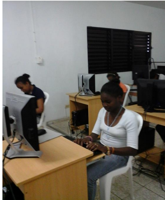
Clases de Informática