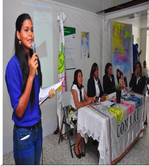
Actividades realizadas en los Centro de Atención Integral de Adolescentes en Conflicto con la Ley Penal, Ciudad del Niño, Hato