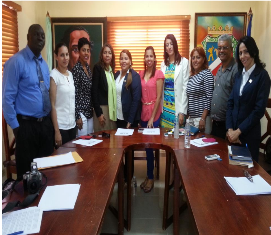
Conformación del Director Municipal del Municipio de Villa Hermosa