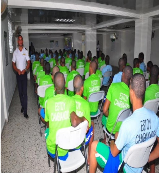
Actividades realizadas en los Centro de Atención Integral de Adolescentes en Conflicto con la Ley Penal, Ciudad del Niño Hato Nuevo,