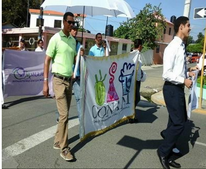
Instituciones educativas que conmemoraron el Día Nacional de los Derechos de la Niñez, el día 06 de octubre del 2015.

CONANI respalda en el municipio de Salcedo el Día de Deberes de los Niños, Niñas y Adolescentes que se conmemora en el país el 29 de septiembre de cada año.