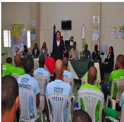
Actividades realizadas en los Centro de Atención Integral de Adolescentes en Conflicto con la Ley Penal, Batey Bienvenido Manoguayabo