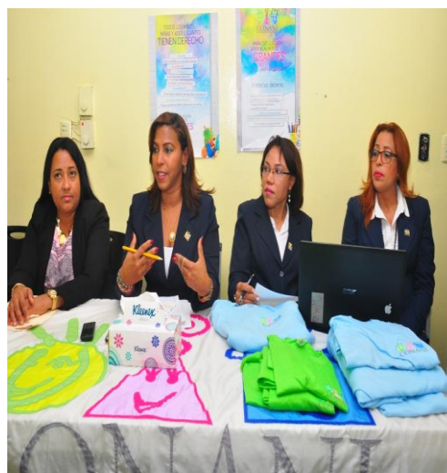
Actividades realizadas en los Centro de Atención Integral de Adolescentes en Conflicto con la Ley Penal, de San Francisco de Macorís.