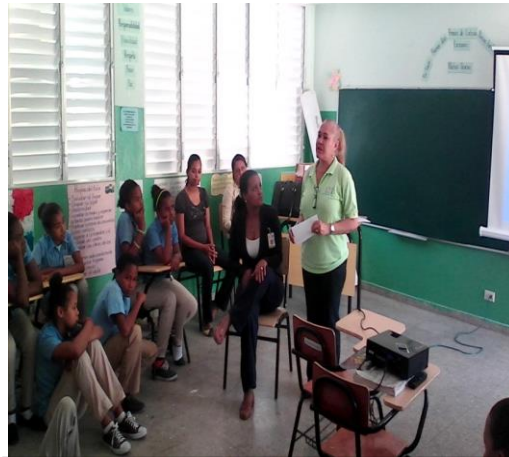
Escuela Básica de Cañongo, provincia Dajabón