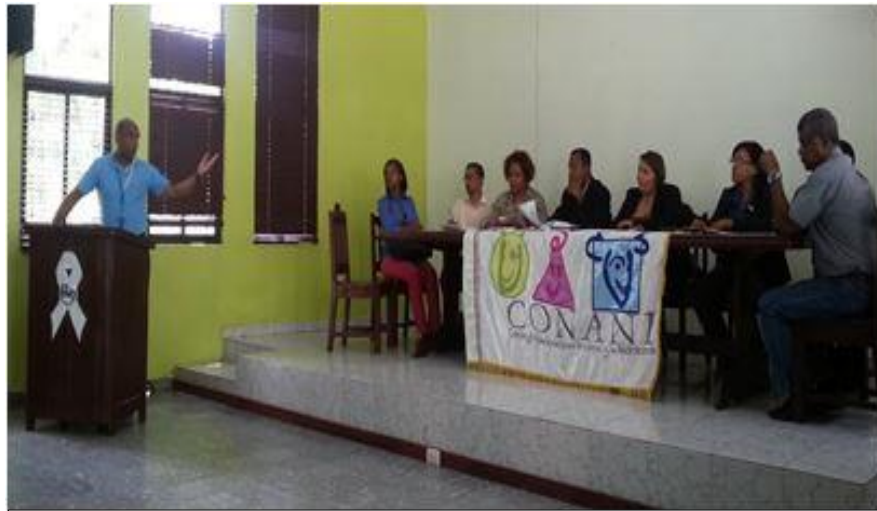
Conformación de la Junta Local de Protección y Restitución de Derechos en la Romana

La Oficina Técnica Regional Yuma en coordinación con el departamento de Gestión Territorial y el departamento de Políticas, Normas y Regulaciones del Consejo Nacional para la Niñez y la Adolescencia –CONANI-, monitorio la elección de los miembros de la Junta Local de Protección y Restitución de Derecho que se llevó a cabo en el salón de Actos de la Provincial de Salud en la ciudad de La Romana.