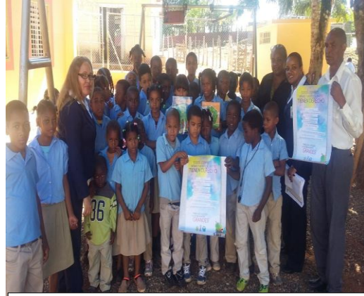
Charlas de los derechos y deberes en escuela de restauración, provincia Dajabón