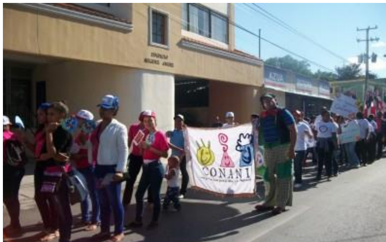
La Oficina Municipal de Azua, se unió a la campaña del Ministerio de Educación.

La Oficina Municipal de Azua se suma a la campaña “De regreso a clases”