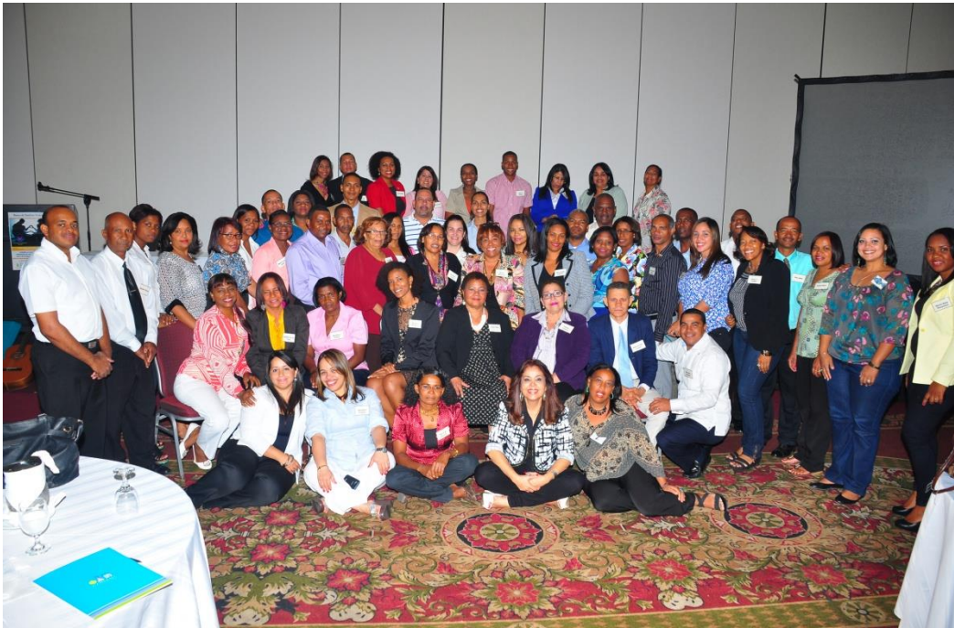
Personas certificadas y acreditadas que pertenecen al Banco de familias

Contar con un Banco de familias; de personas idóneas, con capacidades, motivación y posibilidades para ejercer como familia acogedora de niños, niñas o adolescentes en situación de desprotección, es un ideal al que aspiramos. Para ello se requiere llevar a cabo un proceso de evaluación interdisciplinaria, donde profesionales del derecho, trabajo social y psicología agoten una serie de procedimientos estándares tendentes a conocer mejor a la o las personas interesadas en formar parte del Banco. Las familias que superen las evaluaciones participarán de la capacitación inicial y reciben la certificación que acredita que reúnen las condiciones que permiten que la Oficina Local del CONANI pueda recomendarlas como idóneas.