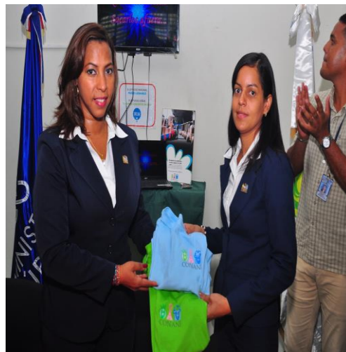
Actividades realizadas en los Centro de Atención Integral de Adolescentes en Conflicto con la Ley Penal, Batey Bienvenido Manoguayabo