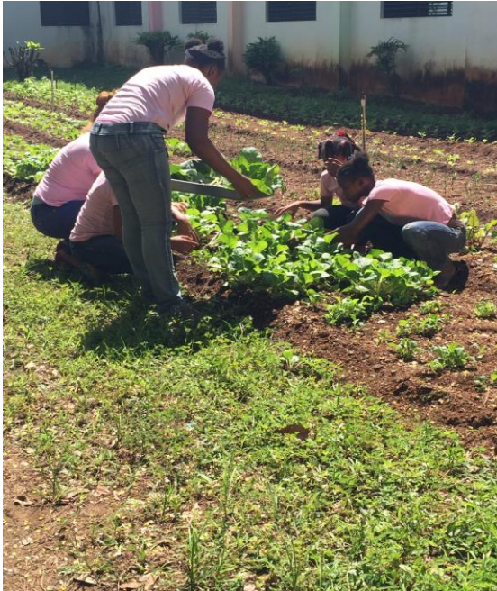
Implementación del Huerto