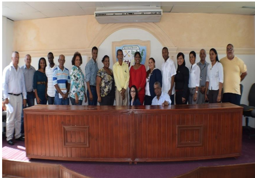
Conformación del Directorio Municipal del Municipio de Guaymate