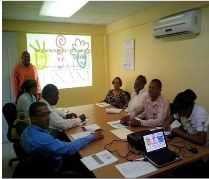
Miembros titulares y suplentes de la JLPRD de Villa Altagracia. y de San Cristóbal.

La Regional Valdesia, San Cristóbal impartió un taller sobre reglamento de las Juntas Locales de Protección y Restitución de Derecho