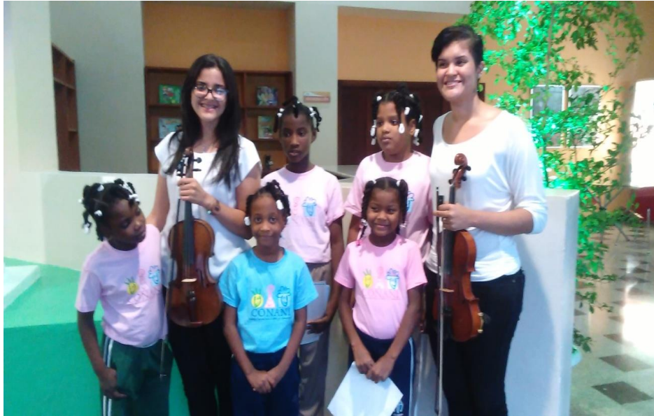
Clases de música