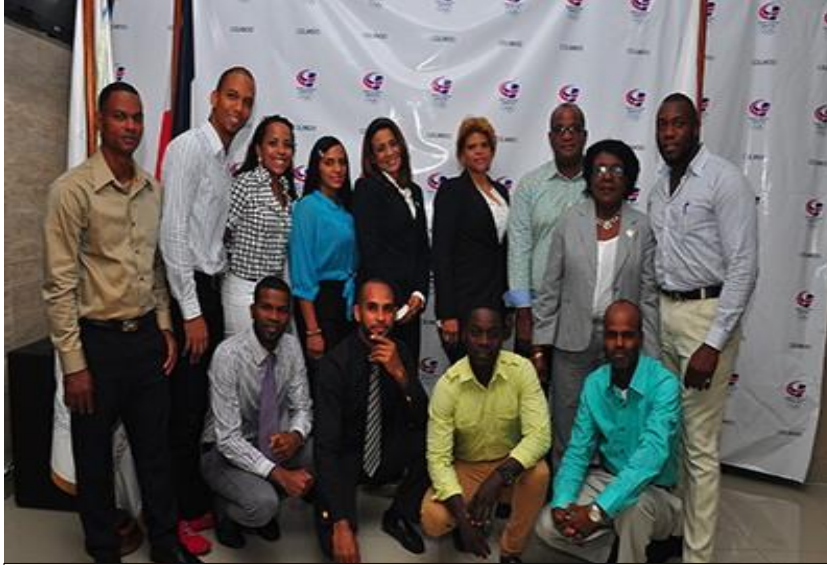
Los servidores de Hogares de Paso fueron capacitados en Educación Física y Recreativa, como respuesta a un acuerdo del Consejo Nacional para la Niñez y la Adolescencia (CONANI), el Comité Olímpico Dominicano y el Instituto de Formación Docente Salomé Ureña

Los servidores de Hogares de Paso fueron capacitados en Educación Física y Recreativa, como respuesta a un acuerdo del Consejo Nacional para la Niñez y la Adolescencia (CONANI), el Comité Olímpico Dominicano y el Instituto de Formación Docente Salomé Ureña. Durante una ceremonia especial recibieron junto a otros estudiantes sus certificados.