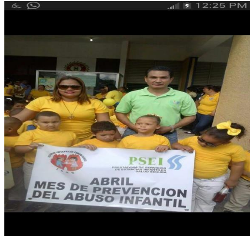
Marcha que se realiza cada año en la Estancias Infantiles Comunitarias de la Provincia Espaillat, con motivo del mes de la prevención del Abuso Infantil realizada el día 17 de abril del 2015