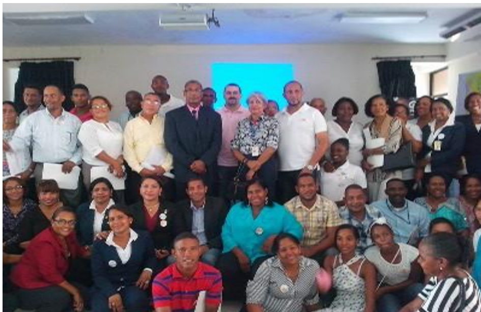
El 3er Encuentro Interfronterizo de Redes de Protección de la Niñez, titulado “Por una niñez protegida, para que lleguen a ser realmente grandes”.

La oficina regional Enriquillo del Consejo Nacional para la Niñez y la Adolescencia (CONANI) realizó, el día 18 de agosto del 2015, el 3er encuentro interfronterizo de redes de protección de la niñez, titulado “Por una niñez protegida, para que lleguen a ser realmente grandes”.