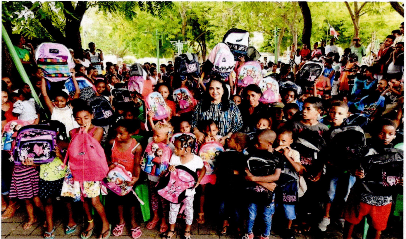
Donaciones de útiles escolares.