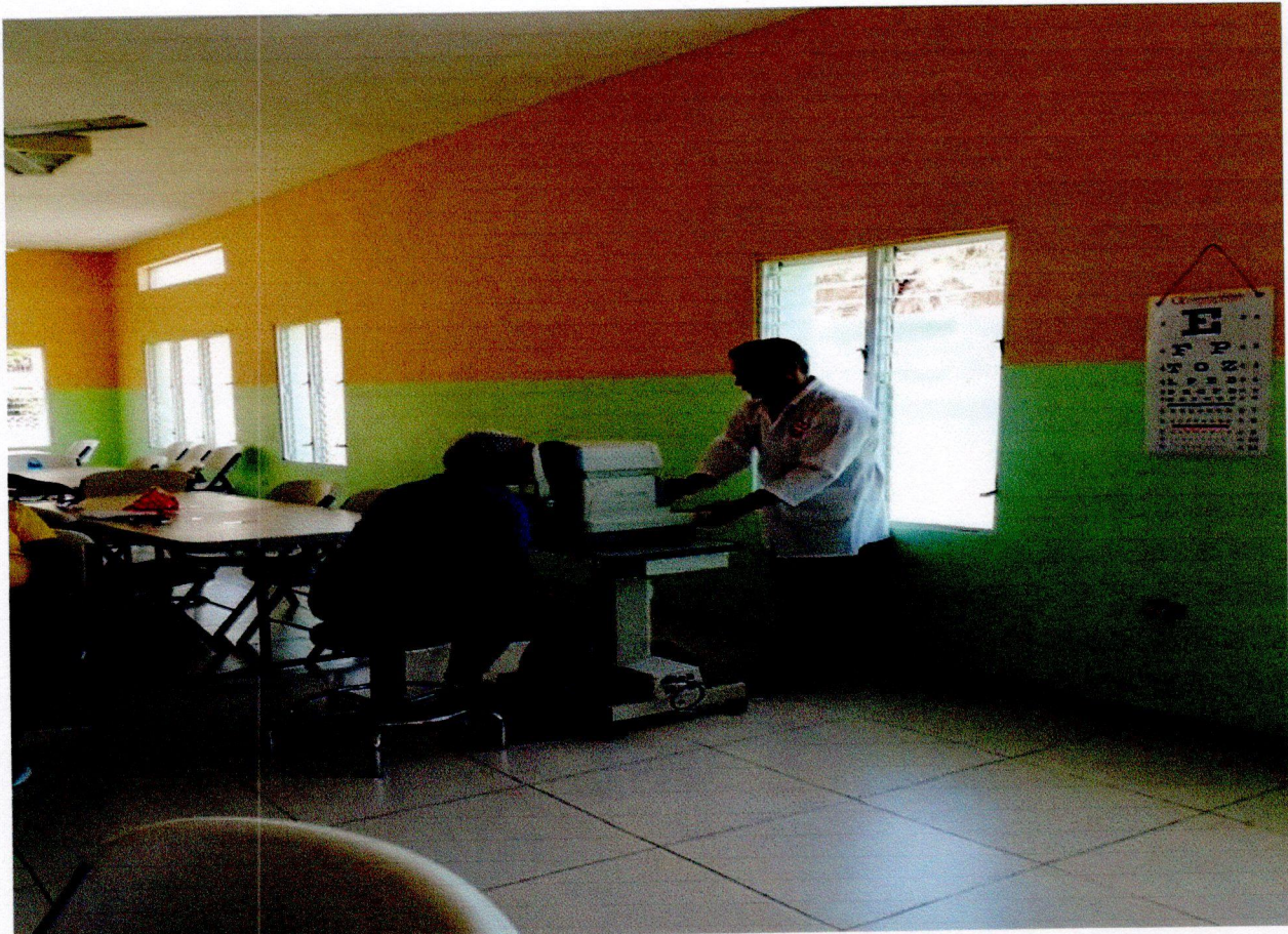
El INAVI junto a Óptica Oviedo Operativo Médico