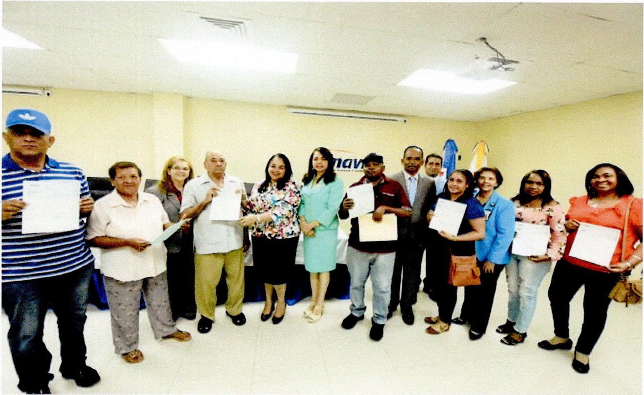
Pago de Prestaciones Laborales.