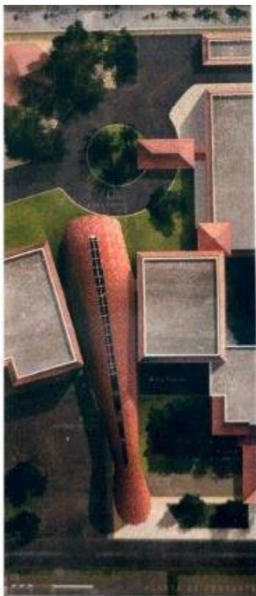
Propuesta ganadora edificio TIC

Se celebró el Concurso de Ideas del Logotipo e Identidad Visual de la Presidencia Pro Témcore 2016 de la Comunidad de Estados Latinoamericanos y Caribeños (CELAC), organizado por el Ministerio de Relaciones Exteriores (MIREX), en el que participaron 5 escuelas de diseño gráfico universidades de todo el país.