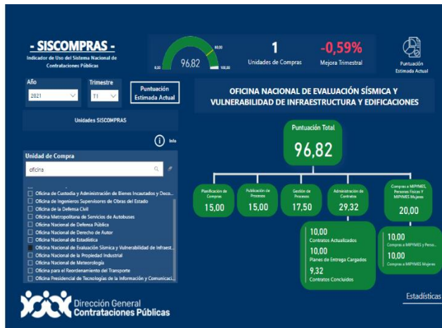
Ilustración 1. Indicadores tomados del SISCOMPRAS, DGCP

Para el trimestre 1 con un indicador del 96.82%