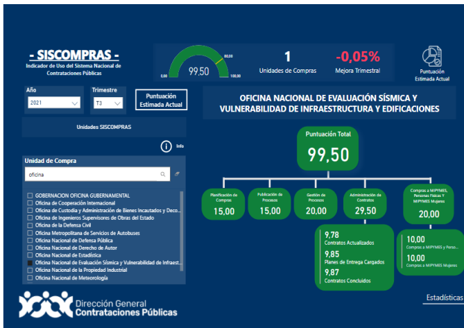
Ilustración 3. Indicadores tomados del SISCOMPRAS, DGCP

Para el trimestre 3 con indicador de 99.50%