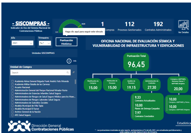
Ilustración 4. Indicadores tomados del SISCOMPRAS, DGCP

Para el trimestre actual, sin considerar las gestiones para cierre del año, tenemos el estimado indicado en el siguiente gráfico: