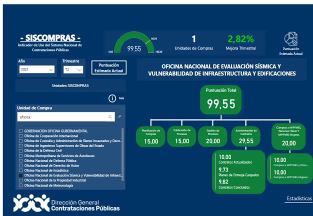
Ilustración 2. Indicadores tomados del SISCOMPRAS, DGCP

Para el trimestre 2 con un indicador del 99.55%