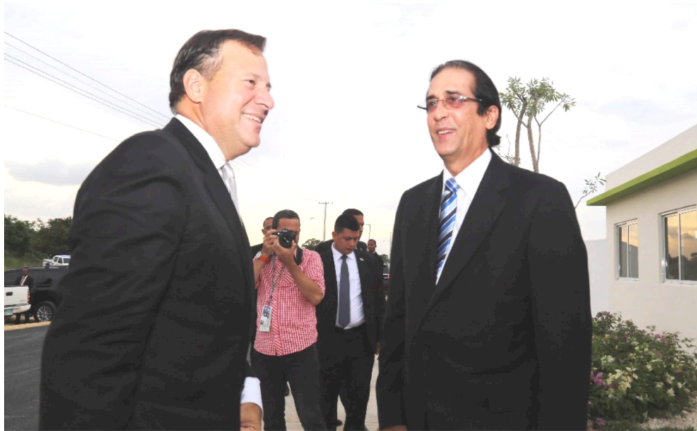
Ministro de la Presidencia, Gustavo Montalvo, junto al presidente de Panamá, Juan Carlos Varela.

El Ministro de la Presidencia, Gustavo Montalvo, presentó los detalles del funcionamiento de varias iniciativas gubernamentales, entre ellas: el Sistema Nacional de Atención a Emergencias y Seguridad 9-1-1 y el Sistema de Metas Presidenciales.