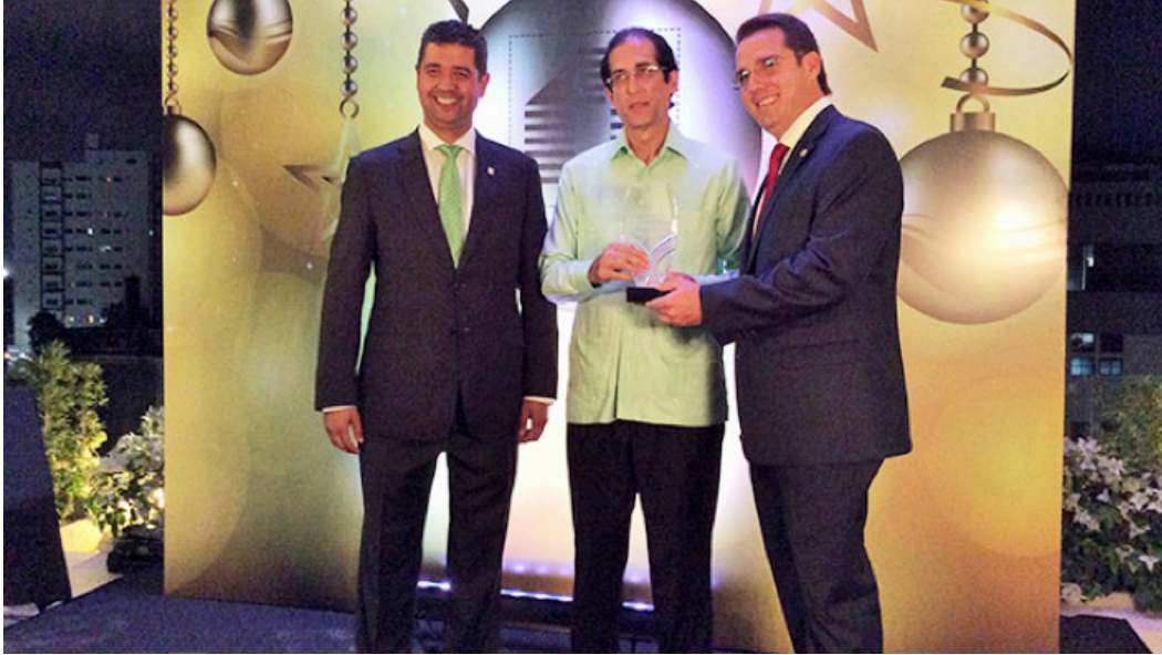
Ministro Gustavo Montalvo mientras recibe el reconocimiento de manos directivos de la Asociación de Constructores y Promotores de Viviendas (ACOPROVI).

El Ministro de la Presidencia, Gustavo Montalvo, fue reconocido en diciembre de 2015 por la Asociación de Constructores y Promotores de Viviendas (ACOPROVI), por su apoyo y colaboración al sector de la construcción y promoción de viviendas en el país.