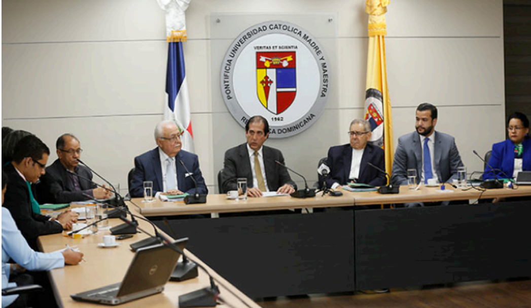
El ministro de la Presidencia junto a varios de los miembros del Consejo Económico y Social en una de las reuniones programadas para tratar la iniciativa Pacto Eléctrico.

El Pacto Eléctrico fue lanzado el 19 de enero de 2015 y durante el año se realizaron 10 consultas regionales y 1 consulta nacional vía web, a fines de que cada dominicano pueda participar del proceso. Luego de ello, se constituyeron 6 mesas de trabajo en torno a los siguientes temas: marco institucional y regulatorio, generación, transmisión, distribución, aspectos tarifarios y financieros y usuarios.