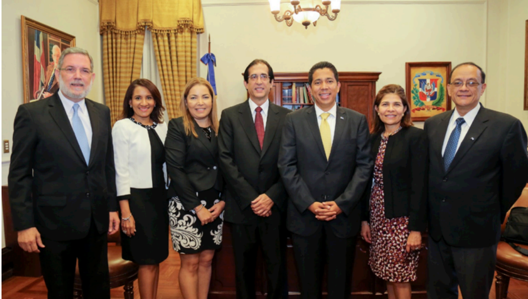
Ministro Gustavo Montalvo junto a delegación de Honduras, Zoraima Cuello y Roberto Rodríguez Marchena.

En este tenor, la delegación agotó una agenda de trabajo que incluyó una reunión bilateral en las instalaciones del Palacio Nacional con el Ministro de la Presidencia, para intercambiar experiencias en diversos temas de interés mutuo como la estrategia de creación de la Banca Solidaria, donde se explicó el procedimiento para facilitar el crédito y cómo se garantiza el retorno del préstamo.