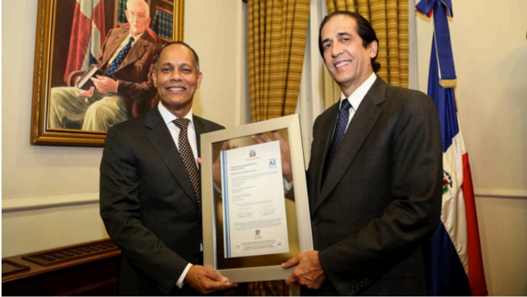
Ministro Gustavo Montalvo mientras recibe el reconocimiento que certifica el portal del Ministerio de la Presidencia con la Norma Nortic A2 de Portales Gubernamentales