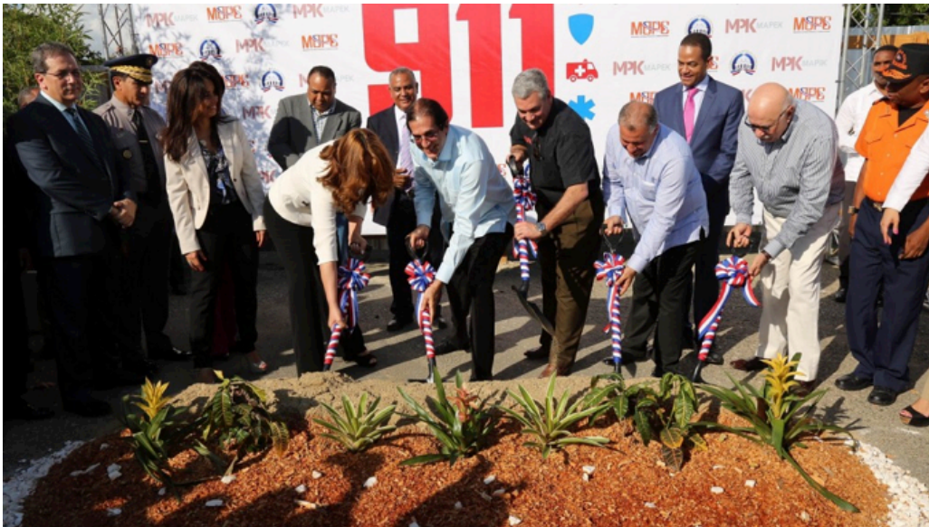
Ministro de la Presidencia, Gustavo Montalvo, da el primer palazo para dejar iniciados los trabajos de construcción del edificio que alojará las instalaciones del 911 en Santiago

El Plan Nacional de Atención Integral a la Primera Infancia Quisqueya Empieza Contigo, dará cobertura en el 2016, a 123,809 niños y niñas, a través de 182 Centros Atención Integral a la Primera Infancia y Centros de Atención Familiar Integral.