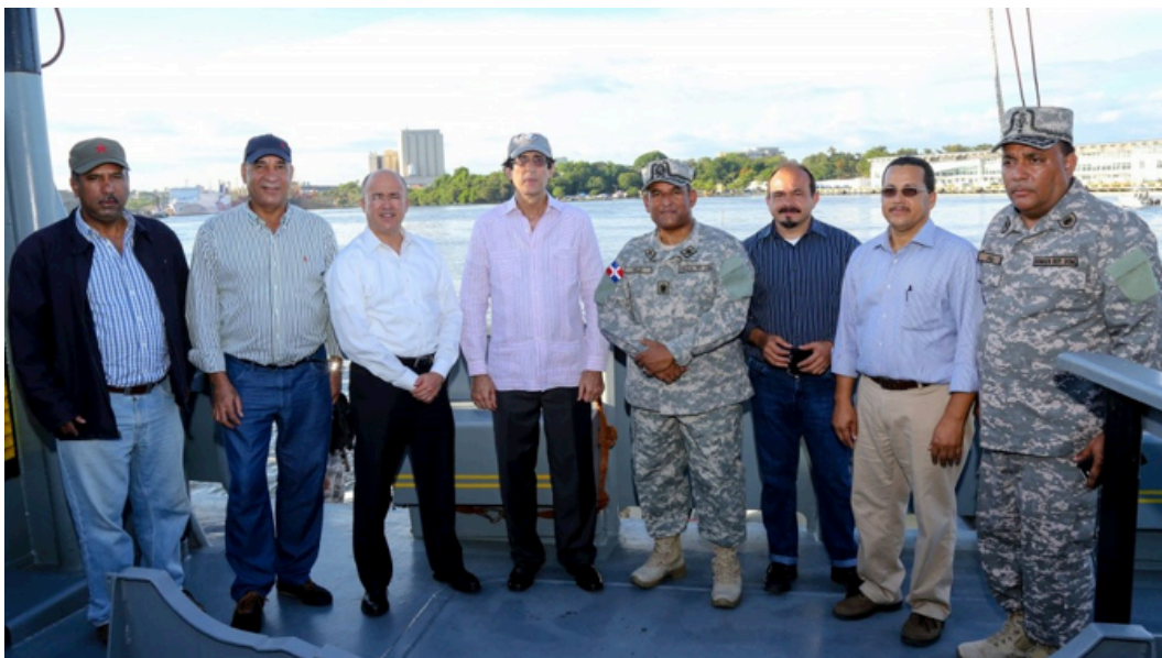
El ministro Gustavo Montalvo, junto a otros funcionarios, durante un recorrido por el río Isabela.

La comisión trabaja de manera estratégica y planificada para cubrir esa parte del Gran Santo Domingo para en el futuro garantizar el abastecimiento de agua.