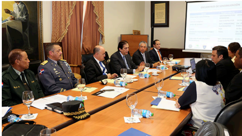
Ministro de la Presidencia, Gustavo Montalvo, en reunión con el Comité de Ruidos para la definición de nuevos protocolos para actividades en espacios públicos.

A su vez, se ha ideado un plan de acción comunicacional, cuyo propósito es concienciar a la ciudadanía sobre los efectos nocivos del ruido y sobre la prevención de la contaminación sónica.