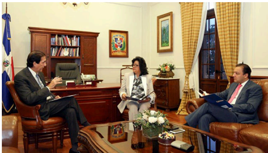
Ministro Gustavo Montalvo mientras conversa con los presidentes del Senado y Diputado, Cristina Lizardo y Abel Martínez.

Por cuatro ocasiones durante este año, el Ministro Montalvo se reunió con la Presidenta del Senado Cristina Lizardo y el Presidente de la Cámara de Diputados, Abel Martínez, a quienes les explicó las prioridades de gobierno en materia de propuestas de leyes que impacten favorablemente en la vida de los dominicanos.