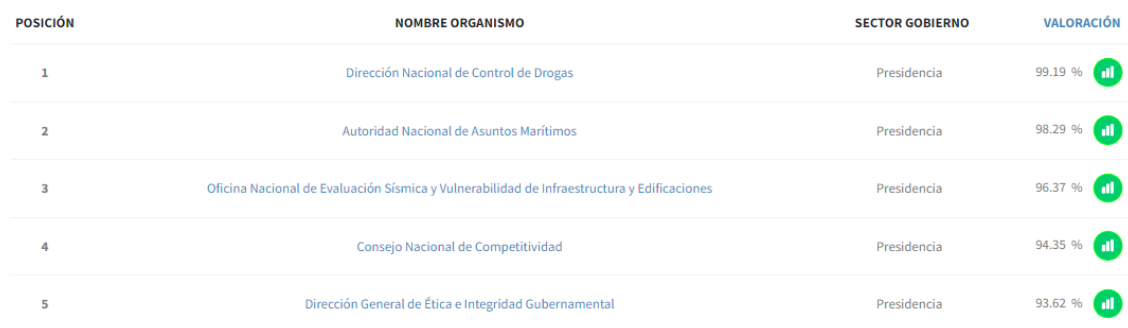
Ilustración 2. Ranking SISMAP

El Consejo Nacional de Competitividad ocupa el 4° lugar en el ranking del Sistema de Monitoreo de la Administración Pública (SISMAP), figurando dentro de las 10 entidades públicas con mayor puntuación en el SISMAP, obteniendo una puntuación de 94.35% en la evaluación de la última actualización del 2023, como se muestra en la siguiente ilustración: