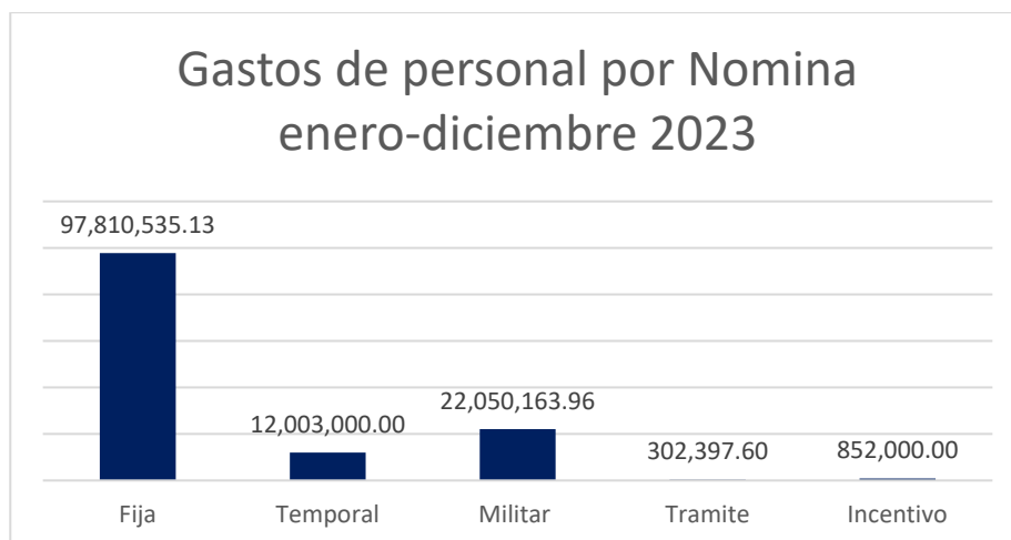
Ilustración 1- Gastos del Personal del CND por nómina.