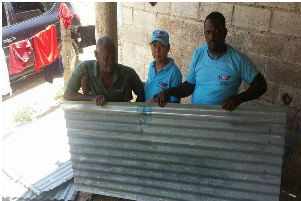
Entrega de materiales para rehabilitación de vivienda, Región Este.