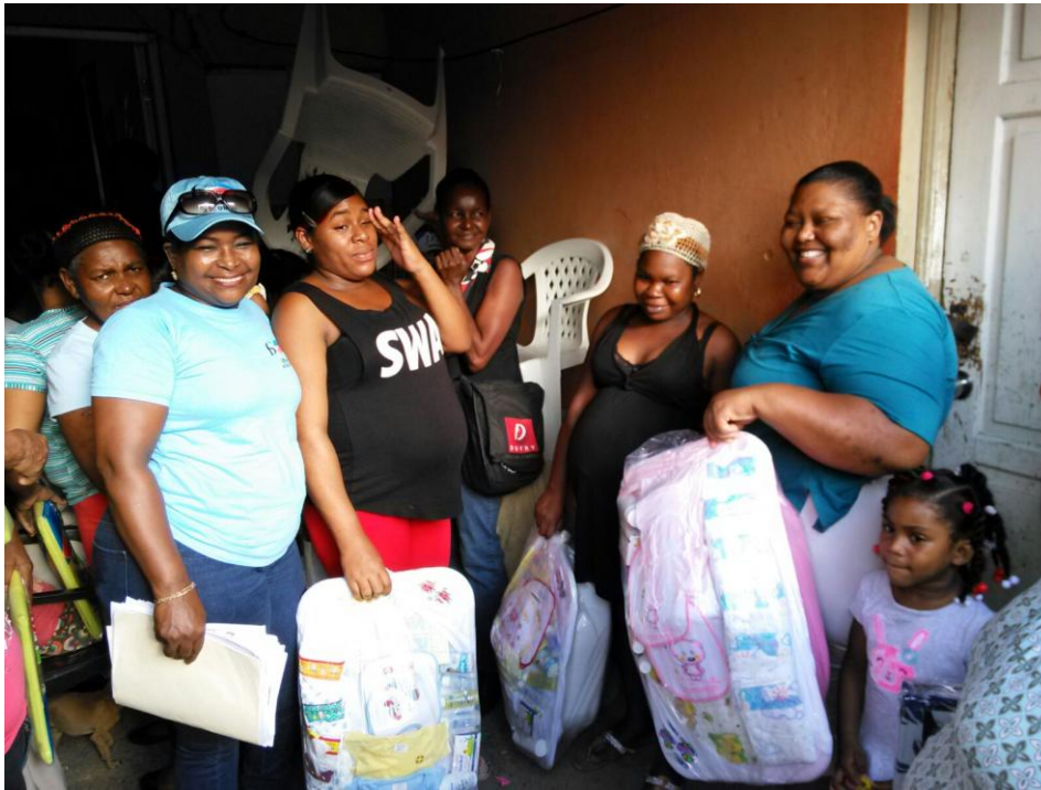
Operativo La Puya de Arroyo Hondo.