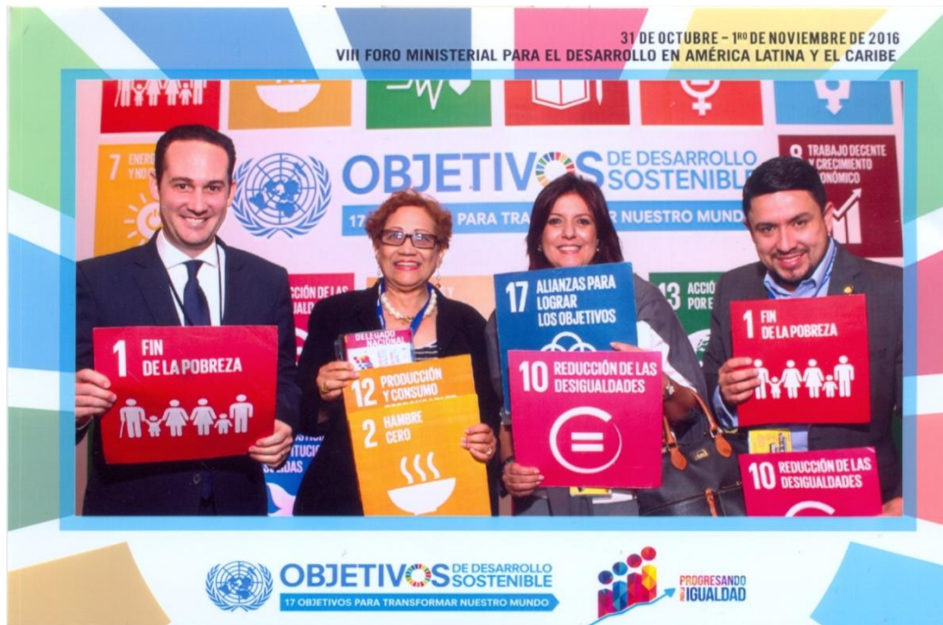
VIII Foro Ministerial para el Desarrollo en América Latina y El Caribe.