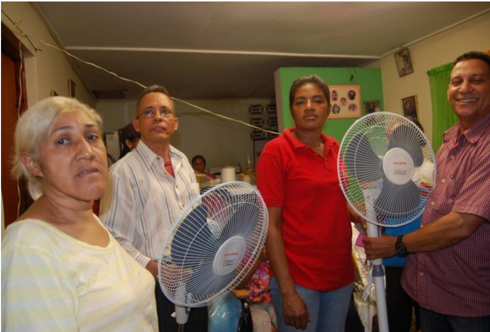
Operativo Prov. Santiago