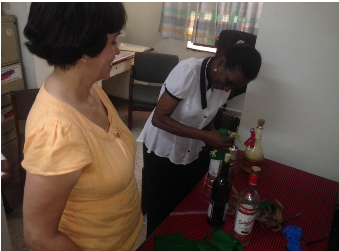
Taller decoración de botellas navideñas, Sede principal DGCD.