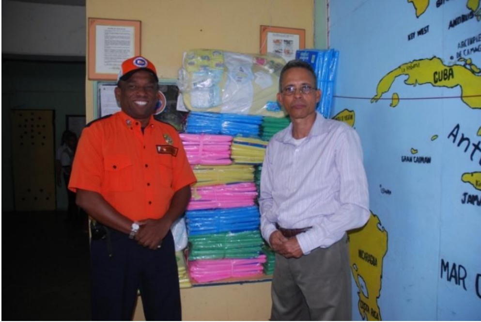
Entrega de artículos Defensa Civil Santiago.