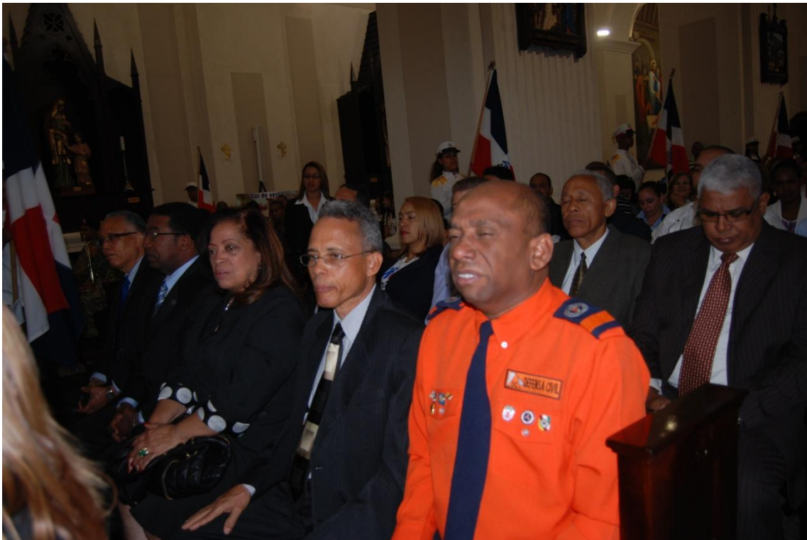
Participación en Tedeum.