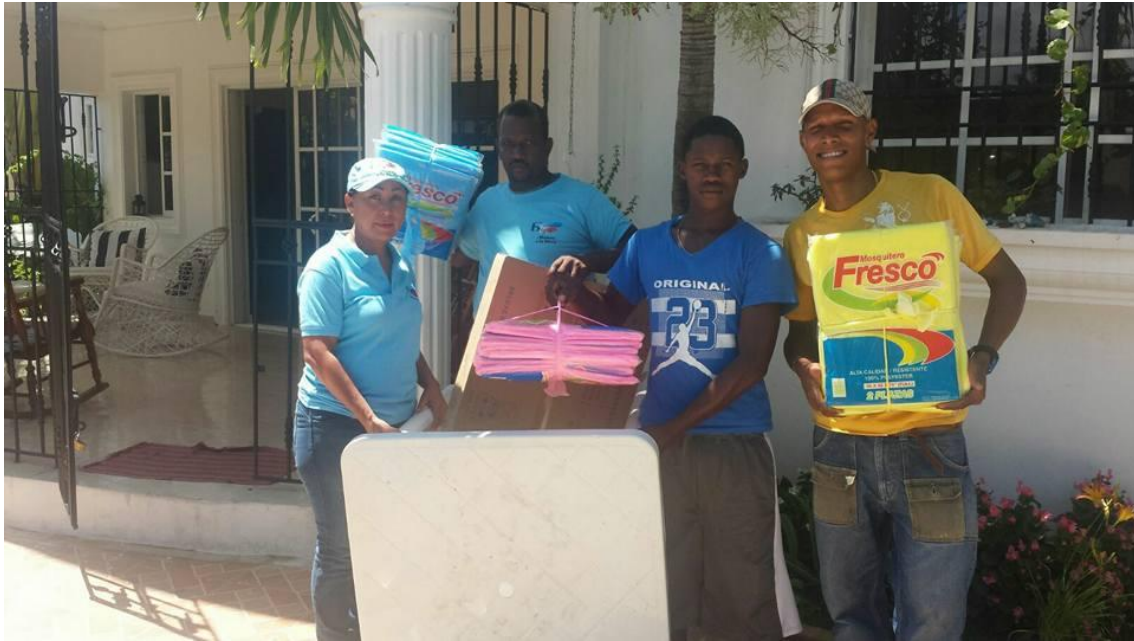
Operativo entrega de mosquiteros, mesas plásticas y estufas, en La Romana.