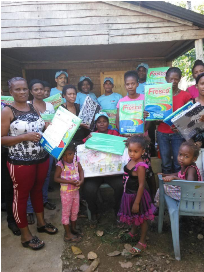
Operativo en Luisa Prieta.