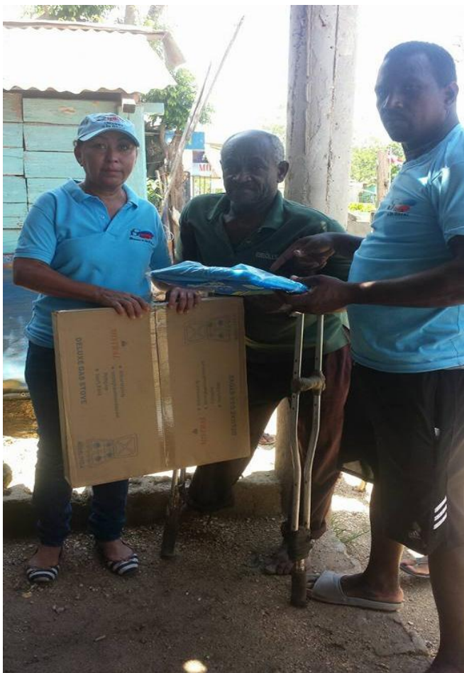
Entrega de estufa y mosquiteros a persona discapacitada.