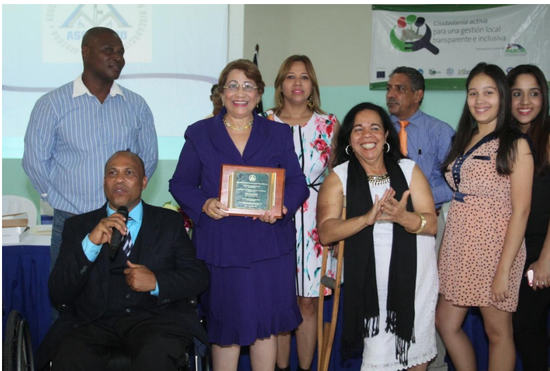
Entrega de reconocimiento Asociación de Personas con Discapacidad.