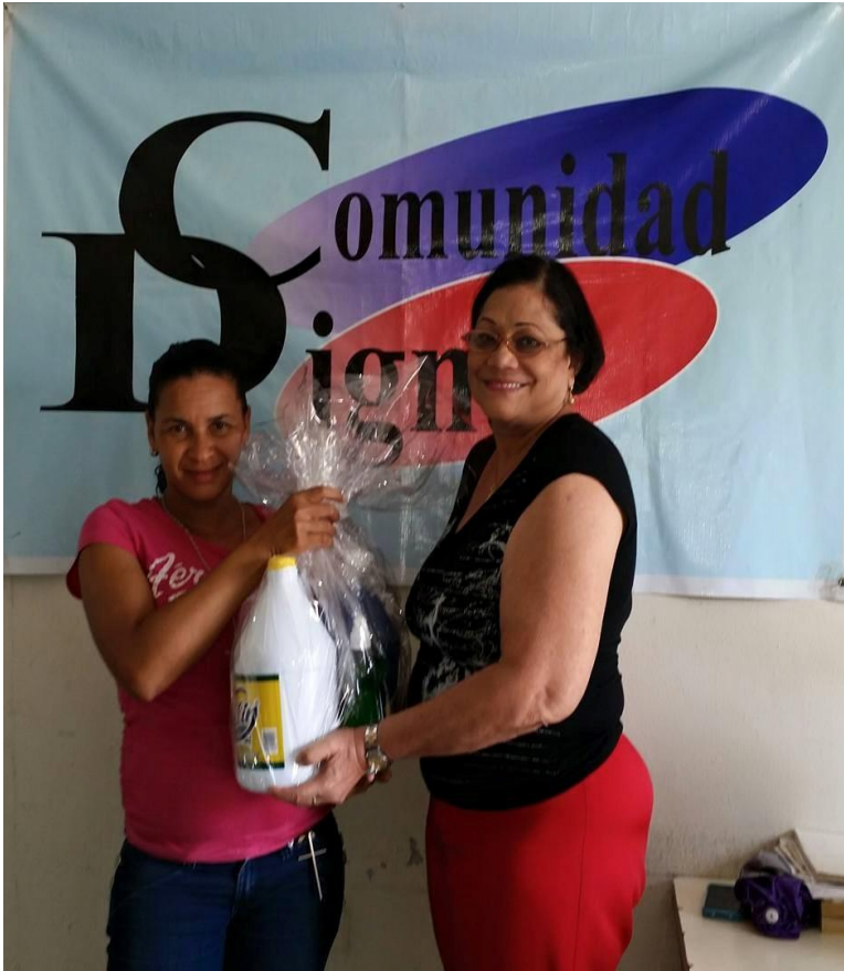
Entrega kit de limpieza en la lucha contra el dengue.