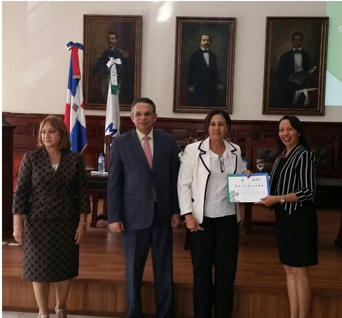
Incorporación de empleados en el Sistema de Carrera Administrativa.-