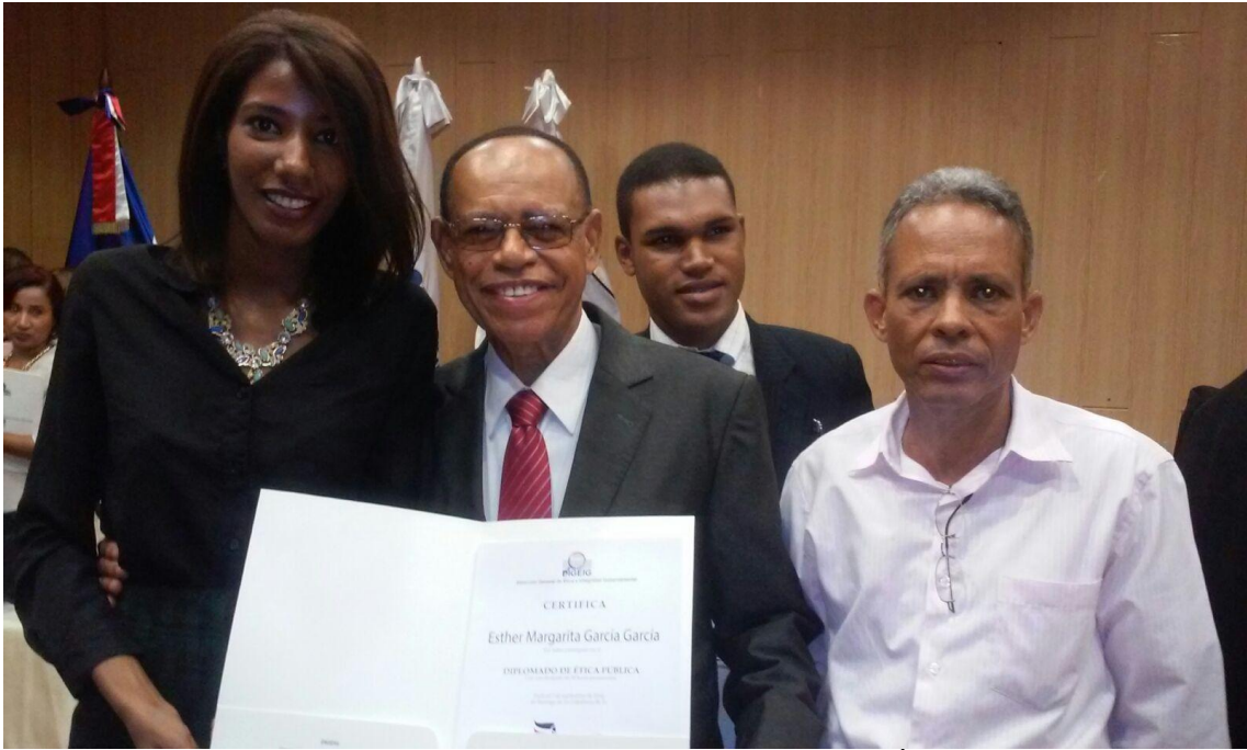
Entrega de certificado Dirección General de Ética.