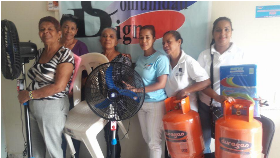
Entrega de electrodomésticos a madres de familia.