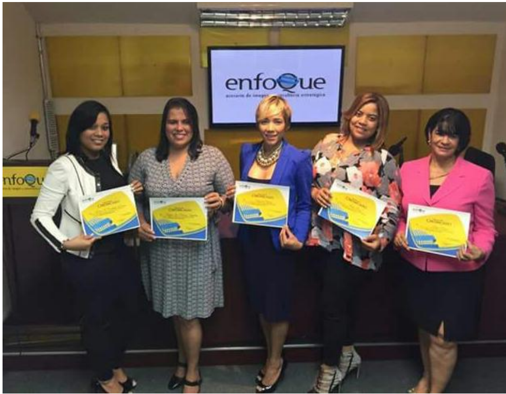
Graduación Curso de Oratoria para Ejecutivos.