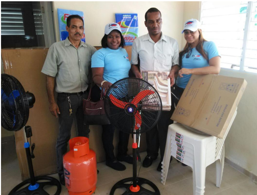
Entrega de electrodomésticos a no vidente en Los Alcarrizos.

Dominicana, Centro de Arte Jaque Viux, Consejo de Apoyo Comunitario, Centro Comunitario Pérez Feliz, Cámara de Diputados de la República Dominicana, Iglesia Tabernáculo de Amor Liberación y Vida, Fundación Todos Unidos, Fundación Unida de San Carlos, Fundación Madre Teresa de Calcuta, Circulo de Mujeres con Discapacidad (CIMUDIS), Dirección General de Embellecimiento, Asociación con Discapacidad (Físico – Motora), Iglesia Cristiana Camino de Vida, Cuerpos de Bomberos Santo Domingo Este, Junta de Vecinos Nueva Esperanza.