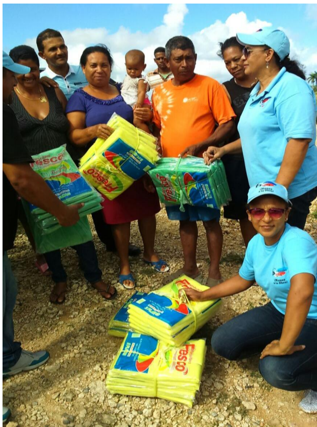
Operativo entrega de mosquiteros.