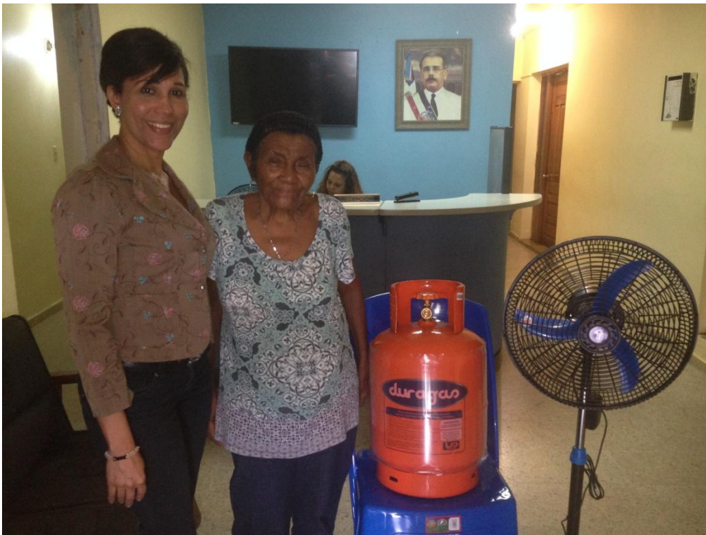
Entrega de tanque de gas, sillas plásticas y abanico a envejeciente.