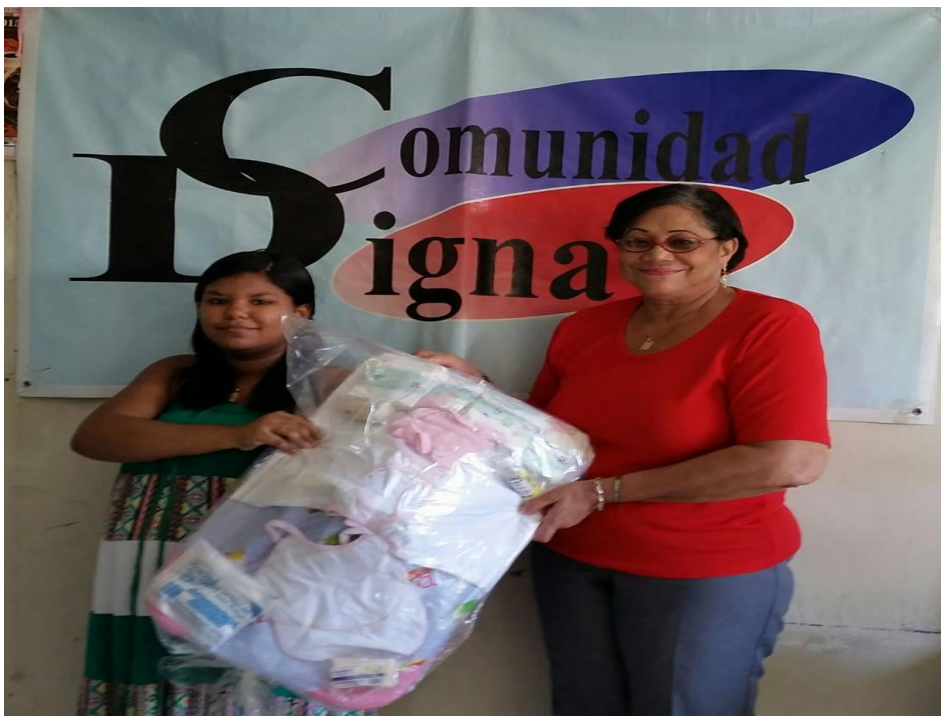
Entrega de canastilla.