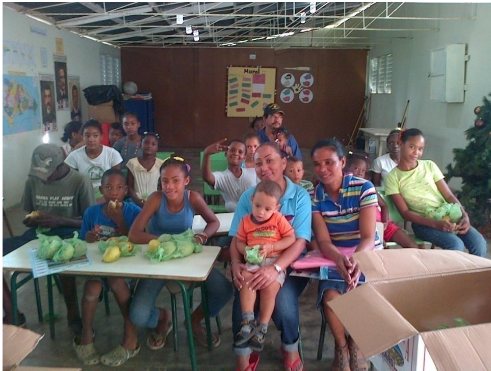
Entrega de frutas y comida a niños de escasos recursos en Escuela Rural, La Romana.