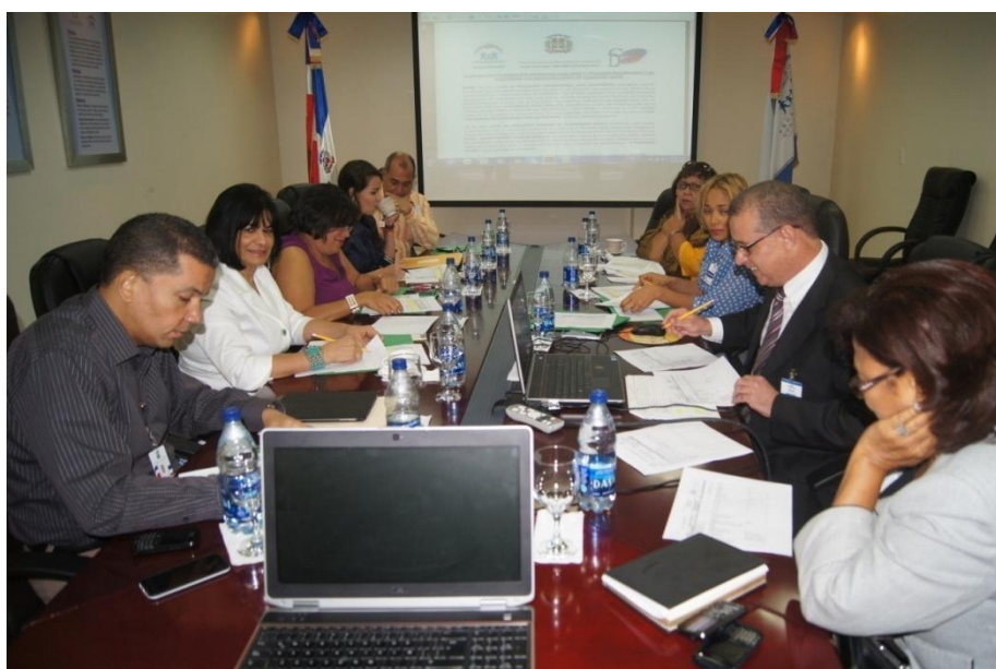
Reunión de planificación en las Oficinas de Progresando con Solidaridad.-

A continuación gráfico de nuestro trabajo en el año 2016: