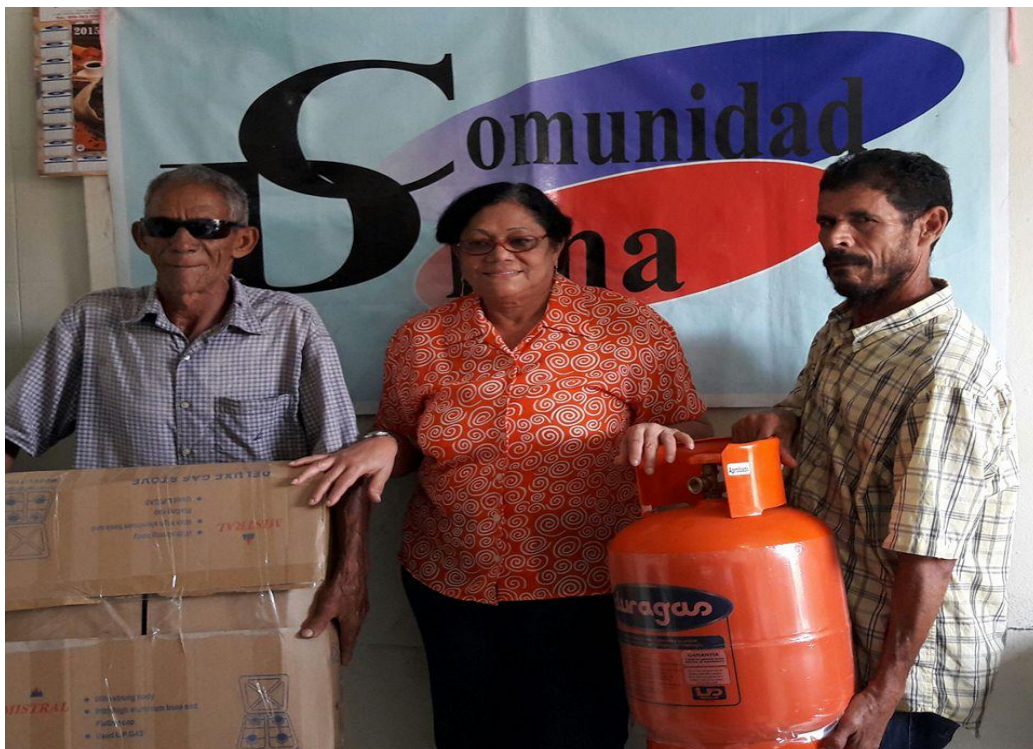
Entrega a envejeciente y no vidente.