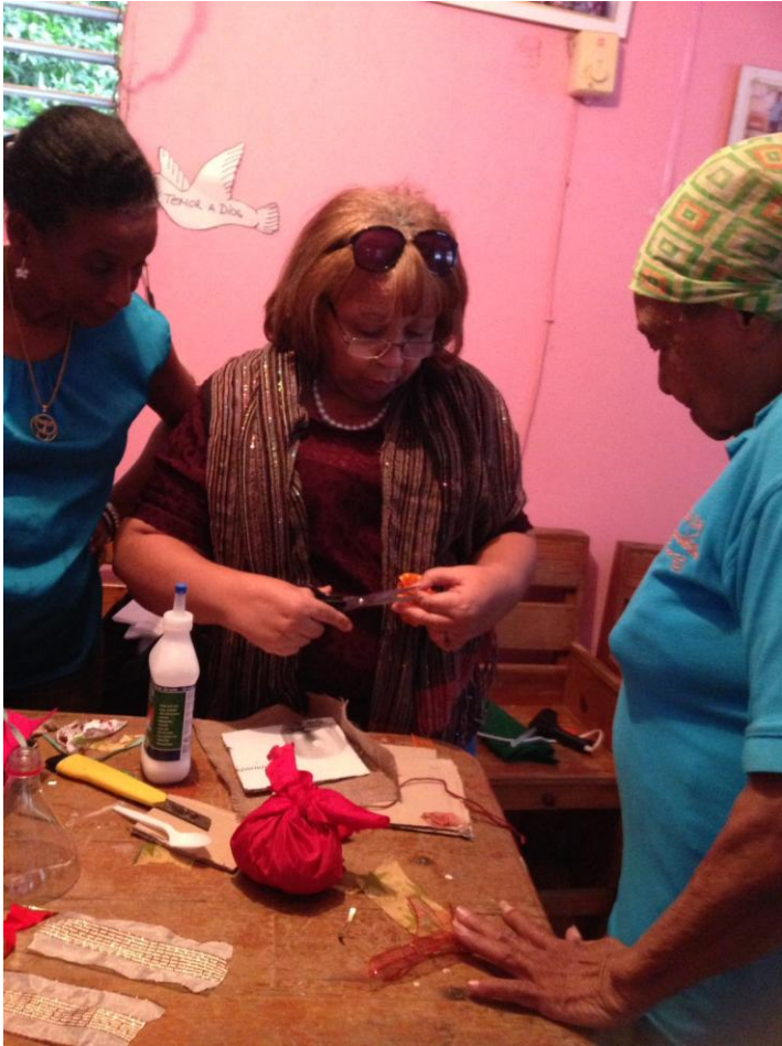
Curso de adornos navideños, Buenos Aires de Herrera.