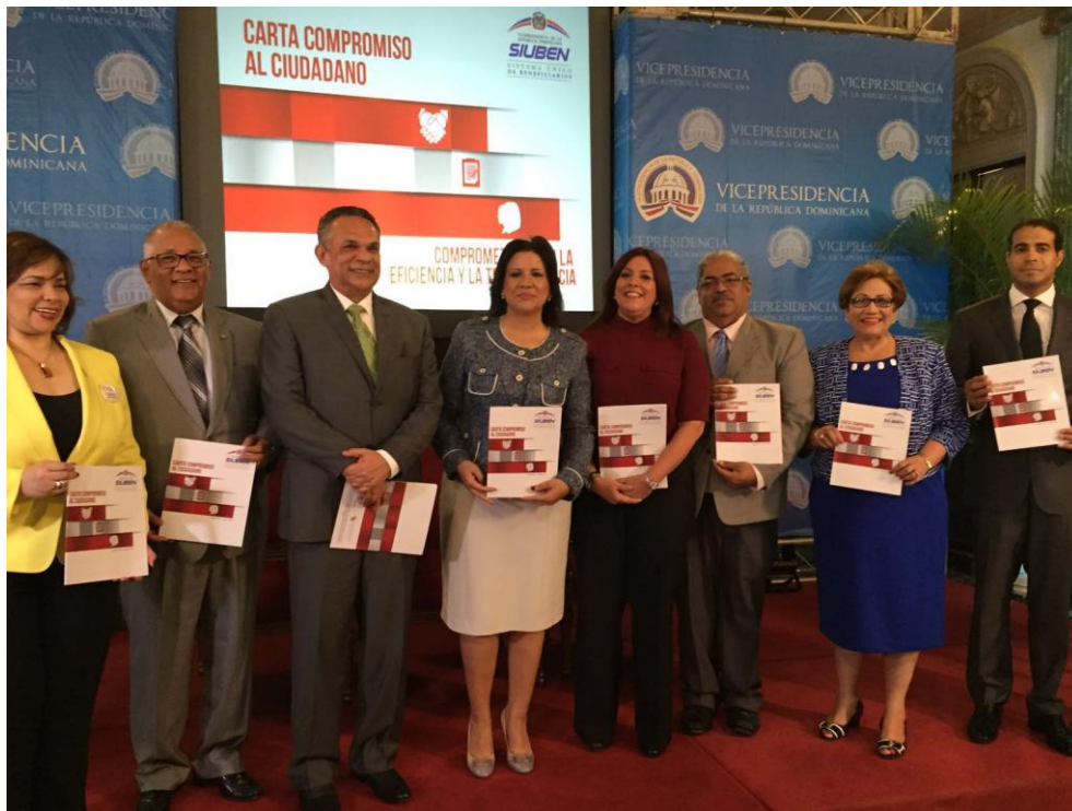
Participación Carta Compromiso Palacio Nacional.