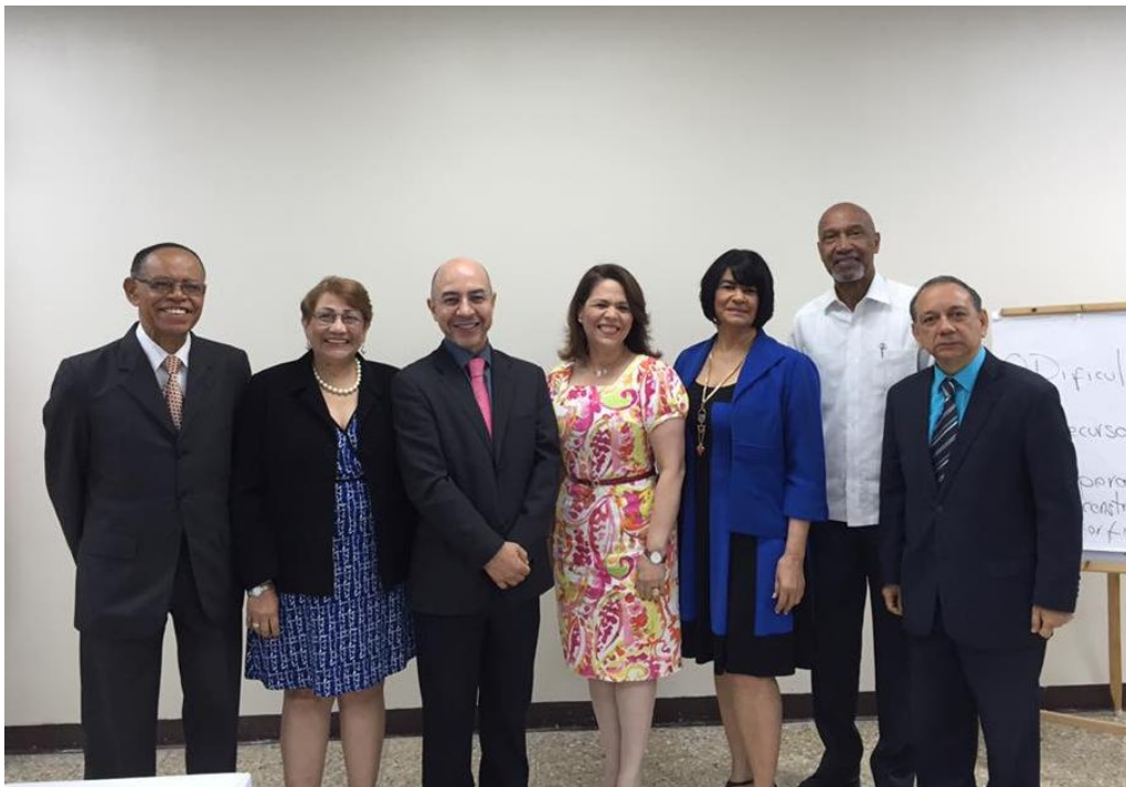
Taller Liderazgo Inspiracional para la Gestión Pública (INAP)