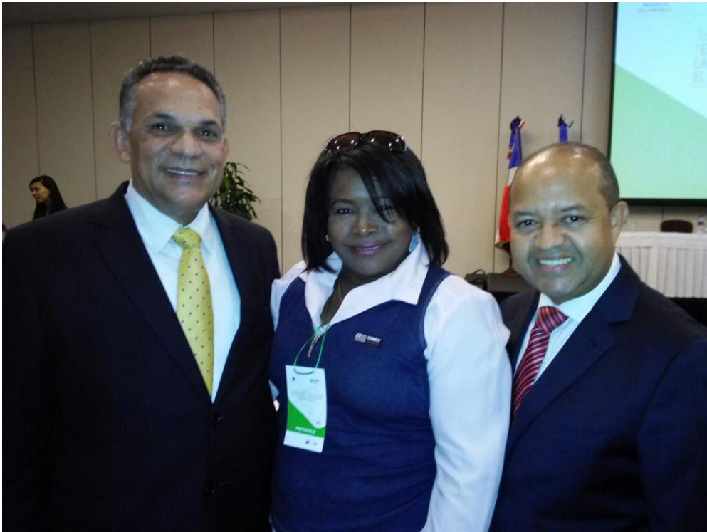
Participación Taller en el Ministerio de Administración Pública.