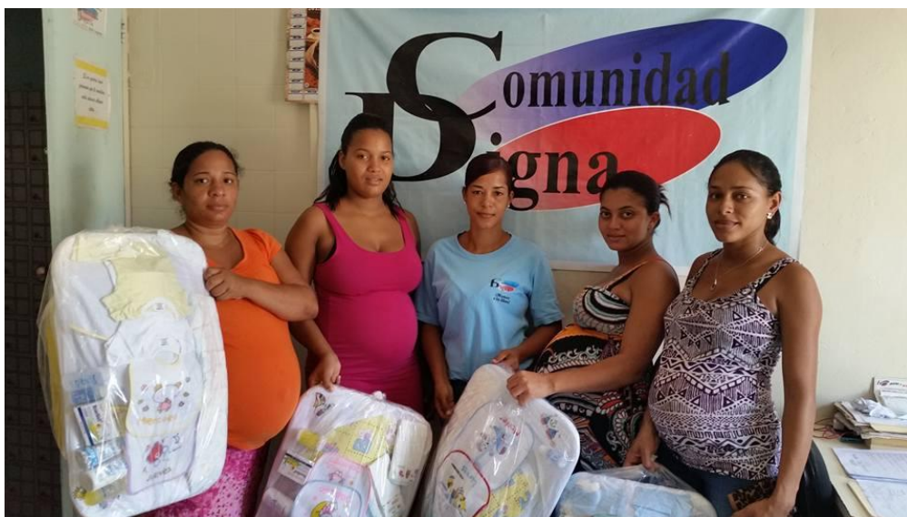
Operativo entrega de canastillas.