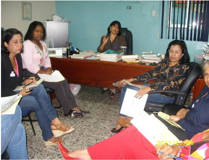
Reunión Comisión de Ética