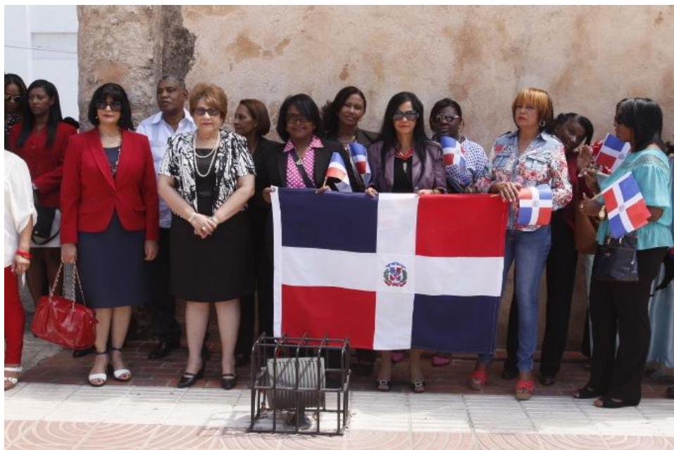
Entrega Floral Altar de la Patria

Participamos en todas las actividades festivas y oficiales que se desarrollan durante el año 2016.