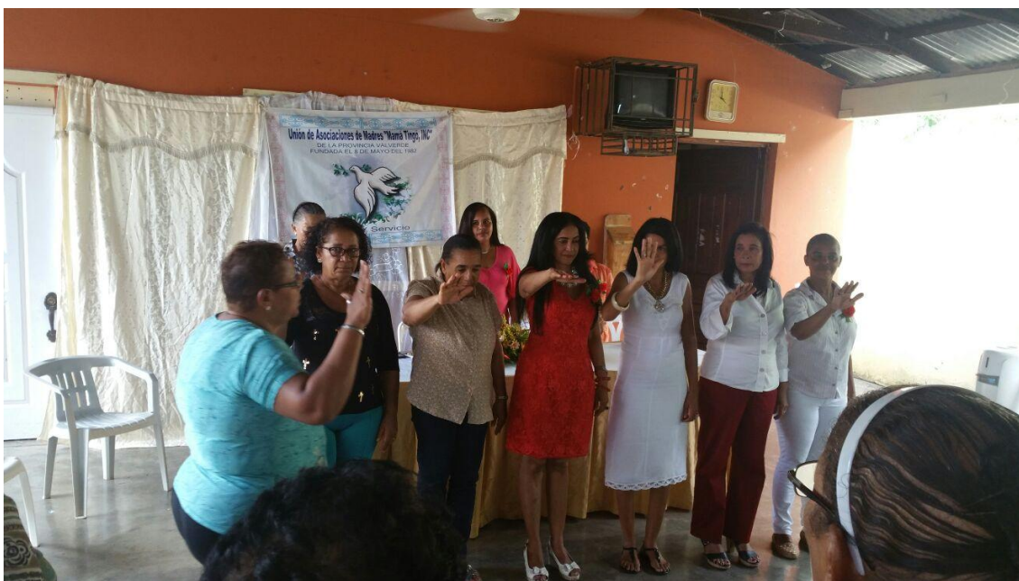
Reunión Club de Madres Mamá Tingo.