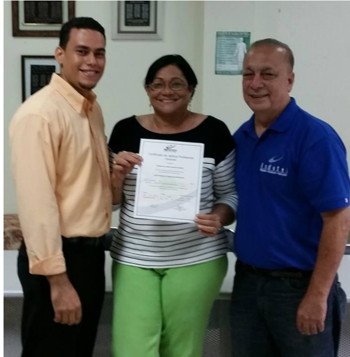
Capacitación en INFOTEP.