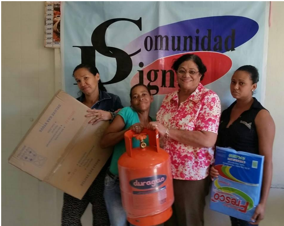
Entrega de electrodomésticos.