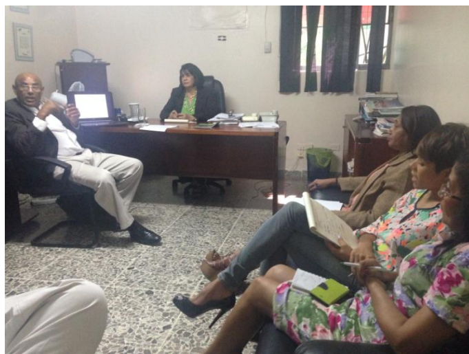
Primer y segundo taller de Planificación Estratégica.