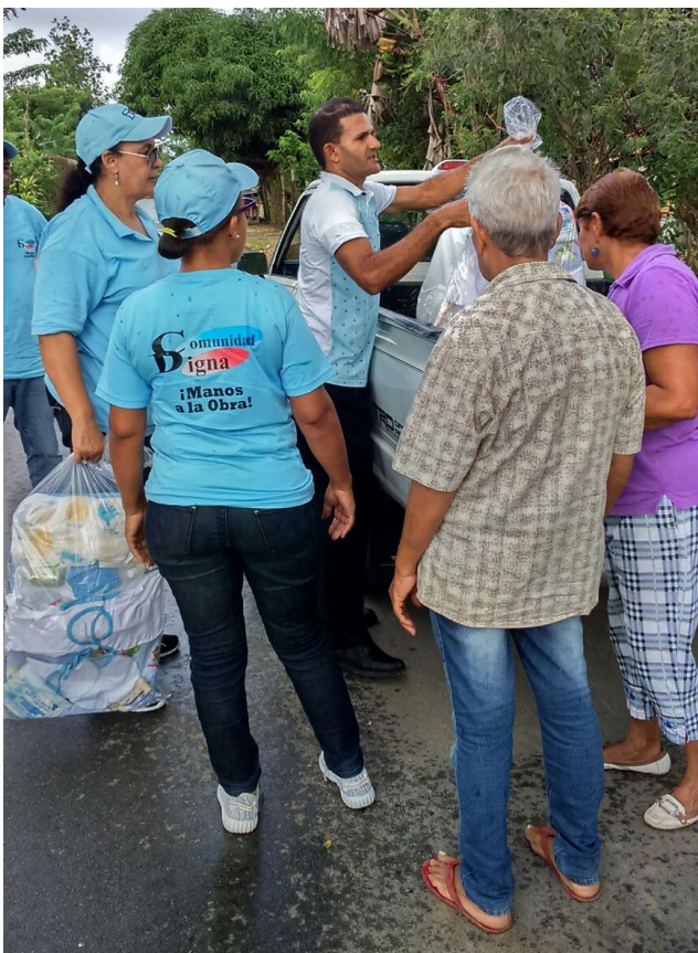
Operativo entrega de canastillas a parturientas de escasos recursos económicos.