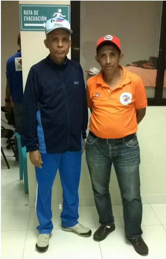
Trabajo con la Defensa Civil, inundaciones en Santiago.