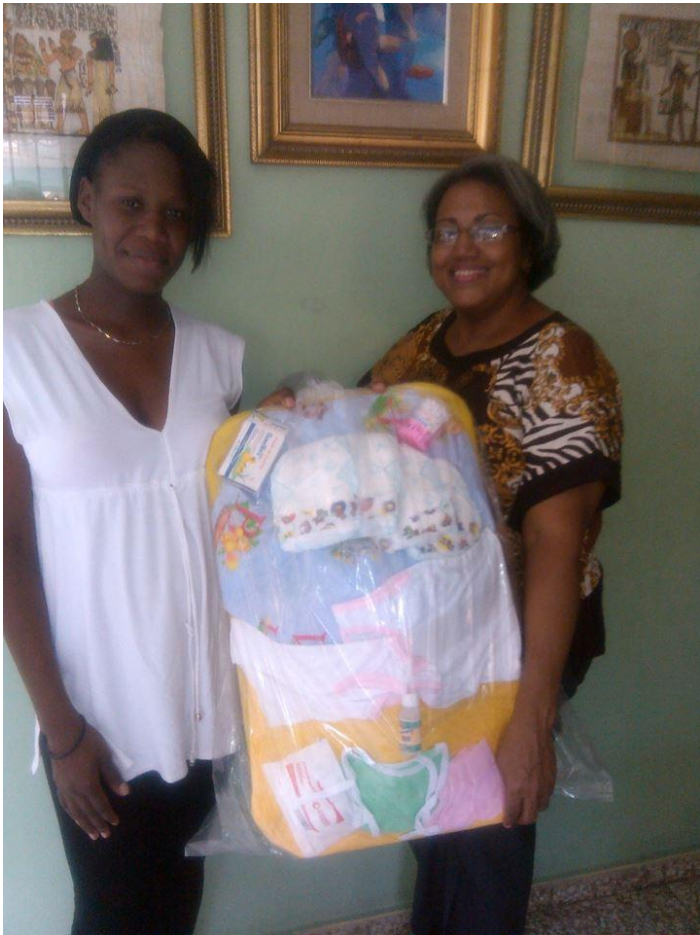
Entrega de canastilla Santo Domingo Norte.