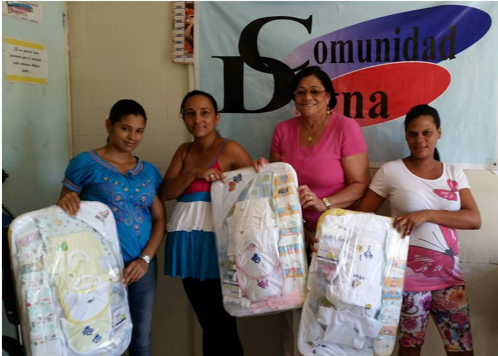
Operativo entrega de canastillas.