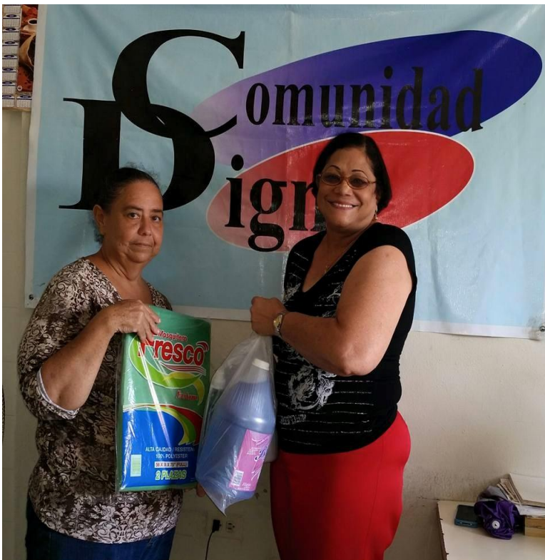
Entrega kit de limpieza y mosquiteros en la lucha contra el dengue.