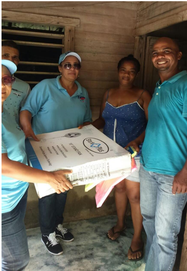
Entrega de estufa a madre soltera de escasos recursos económicos.