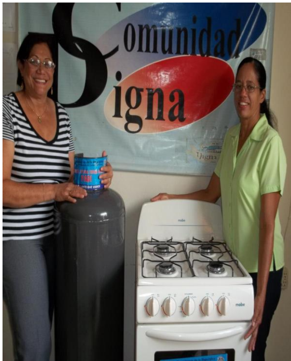
Entrega de tanque de gas y estufa a madre soltera de escasos recursos económicos

A los fines de ajustarnos a las nuevas normas y procedimientos del actual gobierno, participamos en todos los seminarios, cursos y talleres a que fuimos convocados y asistimos a las reuniones de trabajo que fueron celebradas en nuestra sede central.