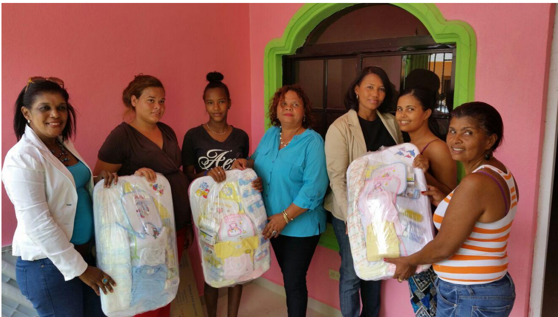
Operativo Provincia Independencia, Región Sur.