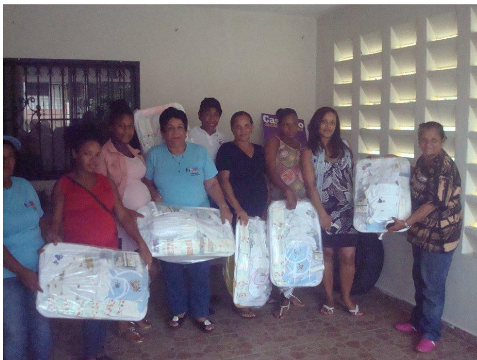
Operativo realizado en la comunidad de Blanco

De igual forma continuamos con la realización de los estudios socio-económicos a las solicitudes recibidas en nuestras oficinas para en el momento que los recursos estén disponibles estar en condiciones de responder de forma inmediata.