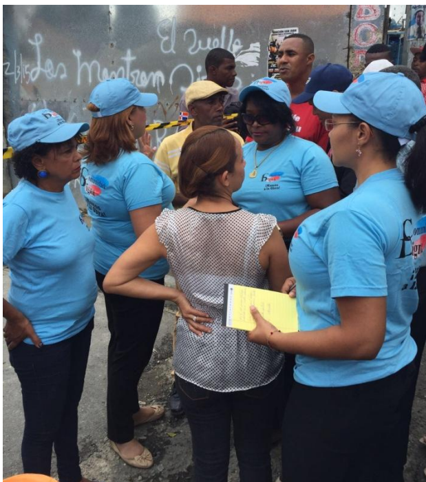
Levantamiento incendio planta de gas, La Esperanza, Los Ríos.

Este Departamento aún con las carencias económicas que tuvimos que manejar este año, se mantuvo inmerso en la búsqueda de soluciones de las múltiples solicitudes que nos llegaban, en algunos casos tramitando por vía de otras Instituciones que disponían de recursos para tales fines pudimos corresponder algunas de las mismas, haciendo nuestro equipo el trabajo de campo que cada caso ameritó.