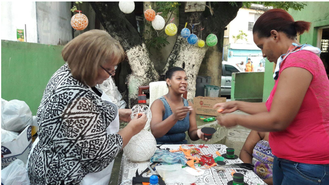
Taller elaboración de adornos navideños; Ensanche Altagracia, Herrera.