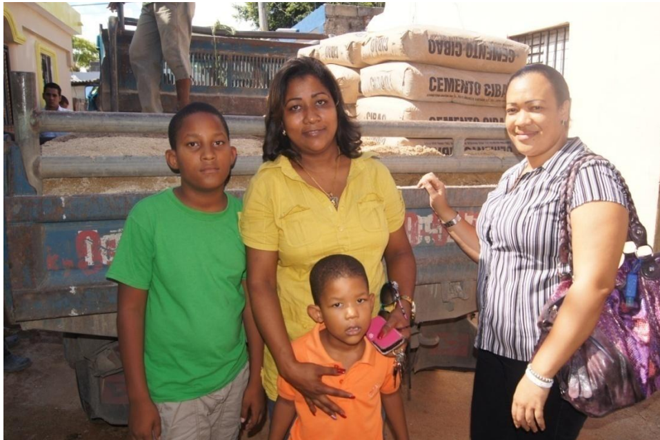
Entrega de materiales para rehabilitación de vivienda