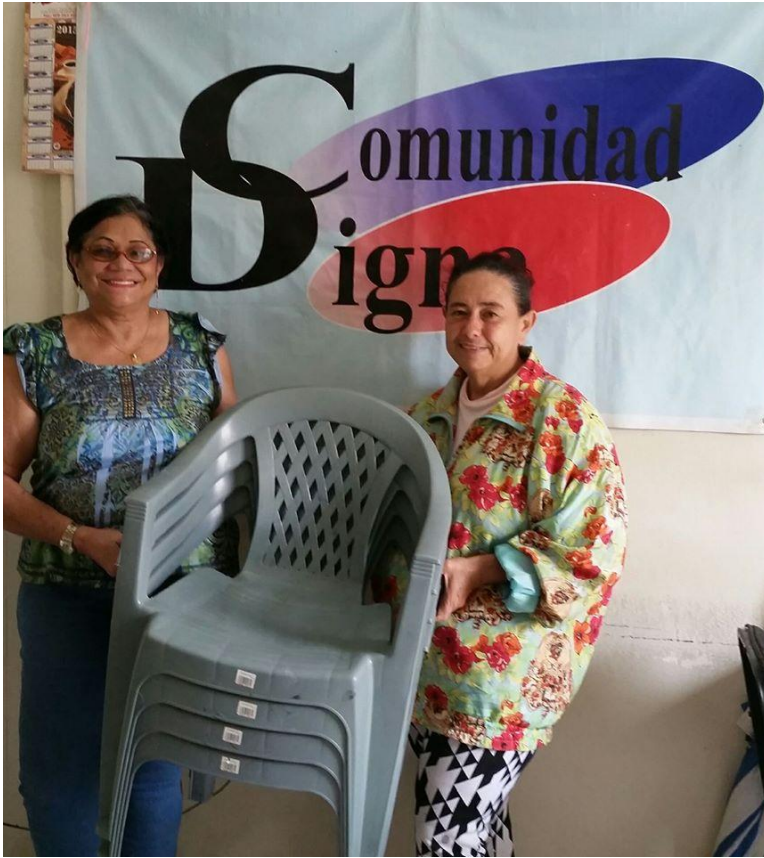
Entrega de sillas plásticas a envejeciente.