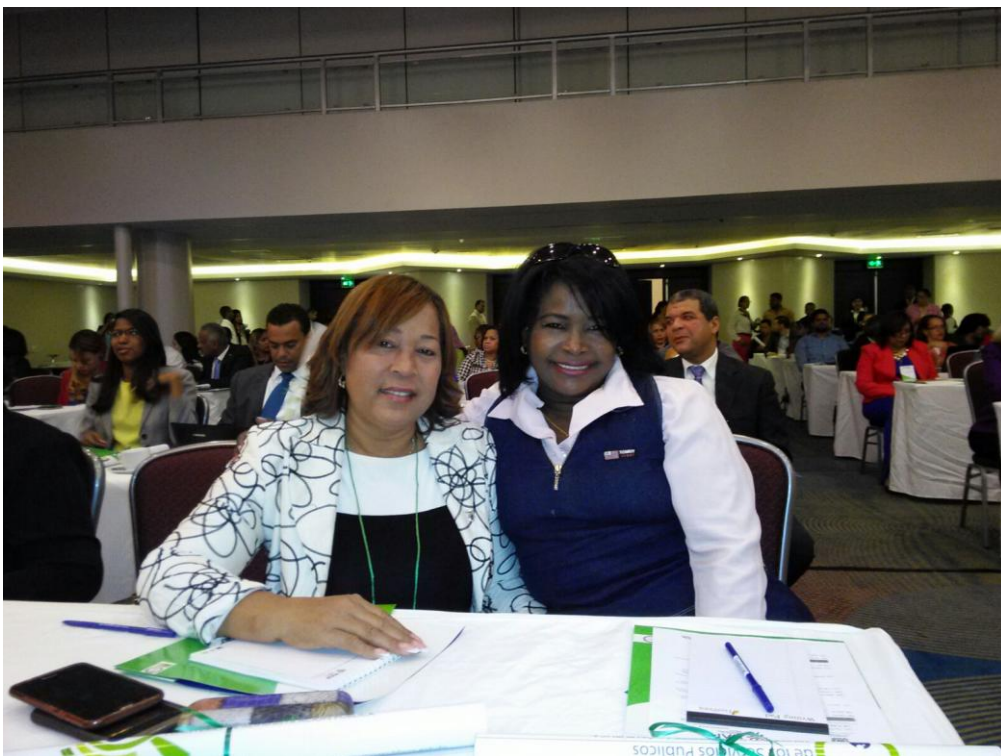
Participación taller “Monitoreo calidad de los Servicios Públicos”.