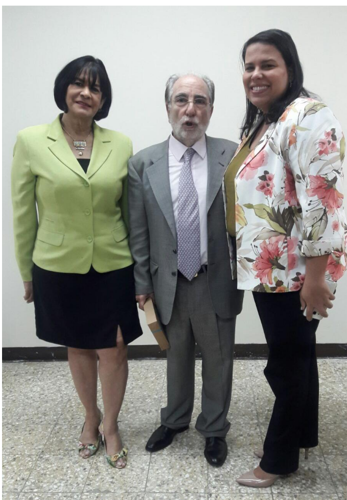
Curso Gestión del Tiempo (INAP).

asignación incompleta o fuera de tiempo de los fondos presupuestarios, pues al cierre de año la institución dejó de percibir la suma de RD$18, 809,082.82, representando un 25% del presupuesto aprobado para el año 2016. Adicionalmente del presupuesto ejecutado por el monto de RD$54,597,739.18 la carga operativa institucional representó el 95% del gasto significando esto que solo RD$2,800,190.03 fueron asignados a los programas que realizamos como institución.