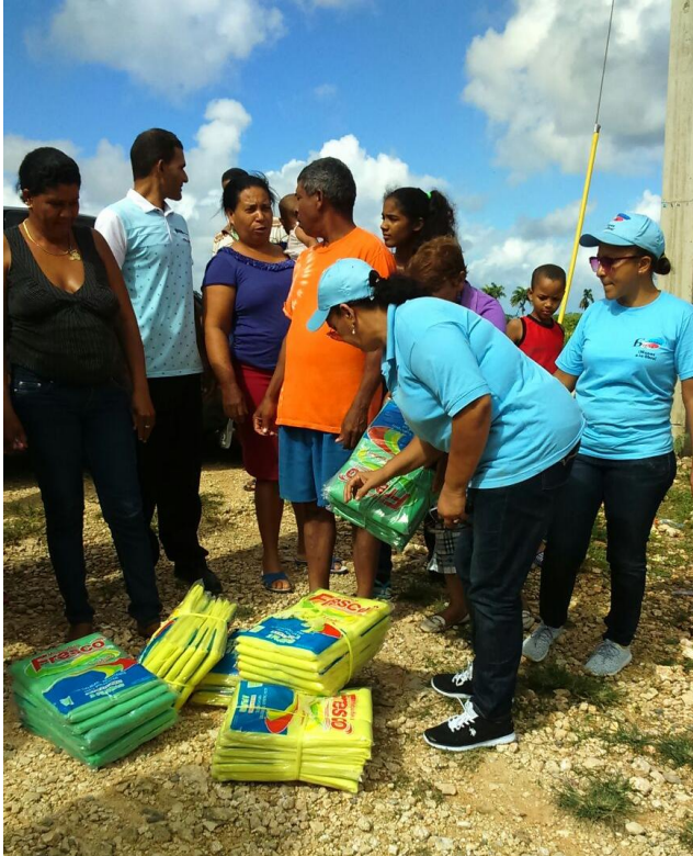
Entrega de mosquiteros Prov. Duarte.

Participamos en todas las reuniones, talleres, cursos y conferencias a que fuimos invitados con el fin de capacitarnos cada día más en el trabajo social y comunitario que nos honramos realizar.