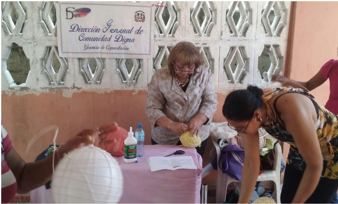
Taller adornos navideños Ens. Espaillat.