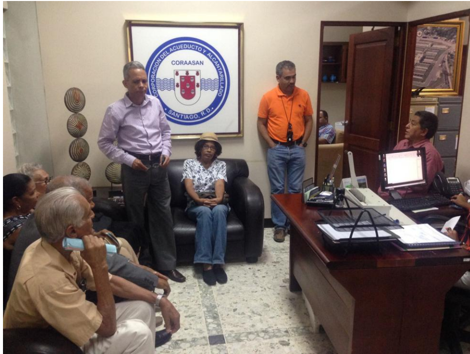
Reunión de Comunitarios en CORAASAN.