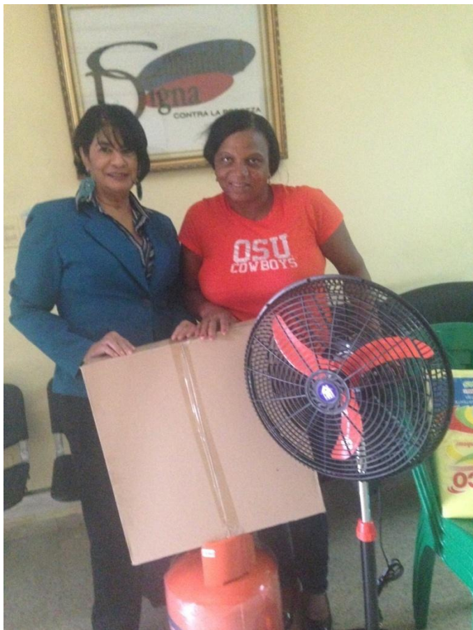
Entrega de electrodomésticos a madre de familia.