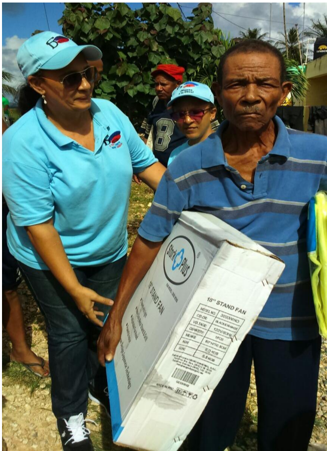
Entrega de electrodomésticos a personas de escasos recursos.