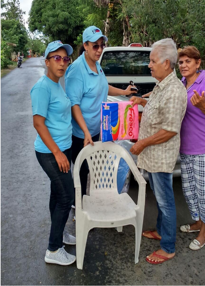
Entrega de sillas plásticas y mosquitero a envejeciente.