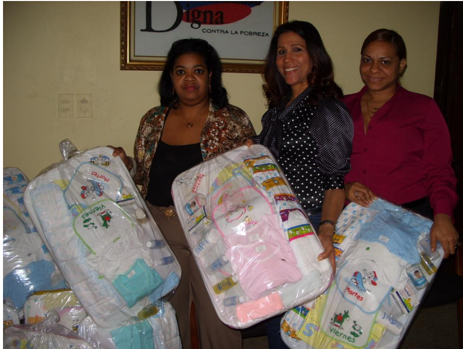
Entrega de canastillas a CIMUDIS