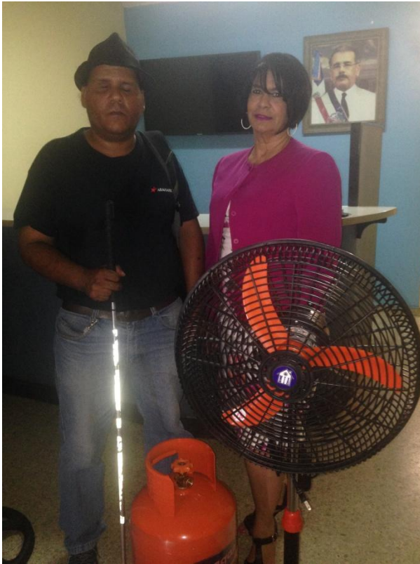
Entrega de electrodomésticos a no vidente.