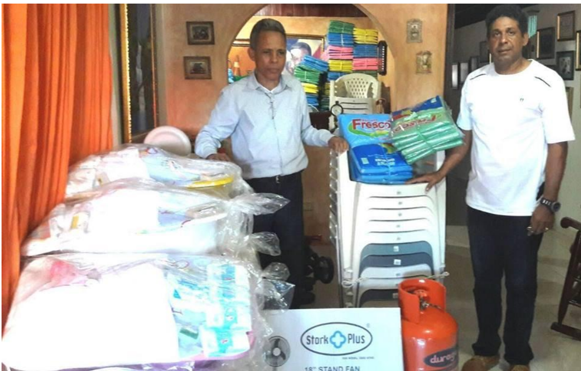
Operativo Santiago, inundaciones Tormenta Matthew