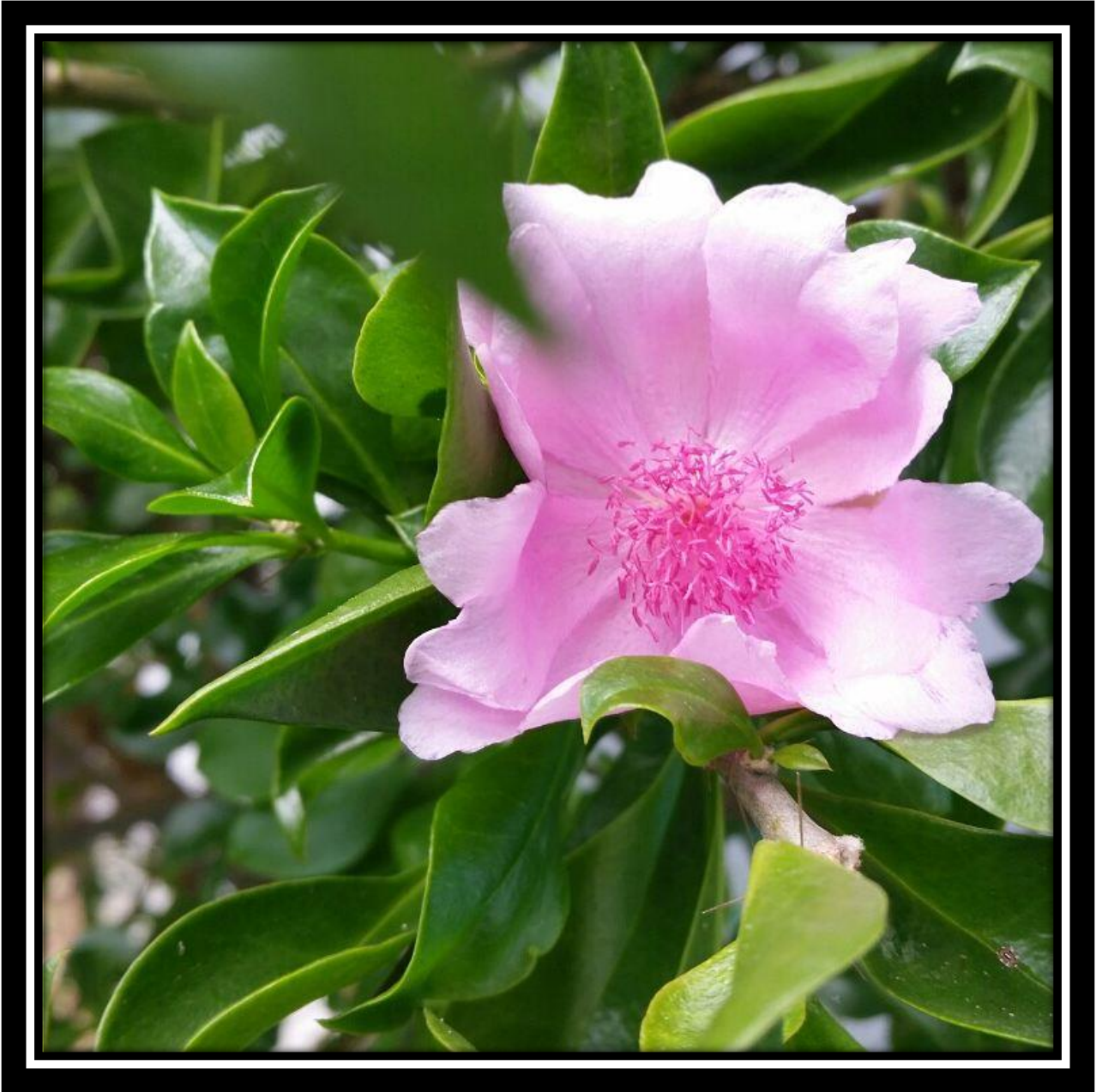
Rosa de Bayahíbe ( Pereskia quisqueyana Alain)