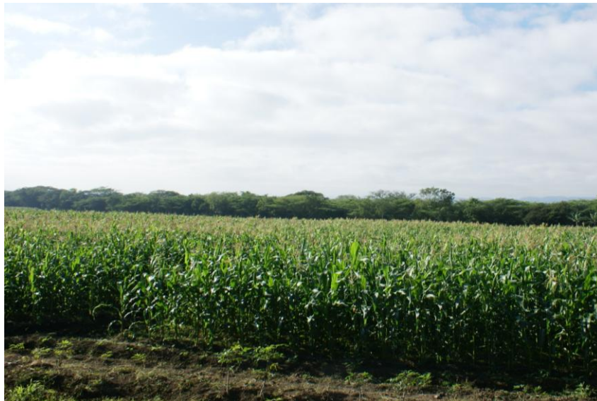
Producción de maíz a través del programa de rotación de cultivos.

Este programa se inicia a medida que los productores van terminando de cosechar el tabaco. Abarca la siembra de diferentes especies alimenticias. El objetivo principal de este programa es ofrecer una alternativa de producción a los productores tabacaleros, al finalizar su cosecha. Además se contribuye de forma