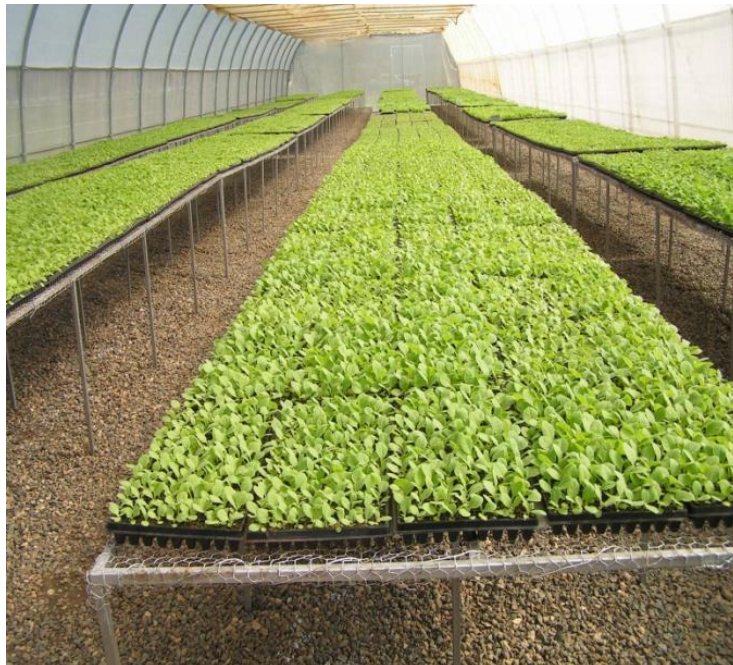
Producción de plántulas de tabaco en ambiente controlado