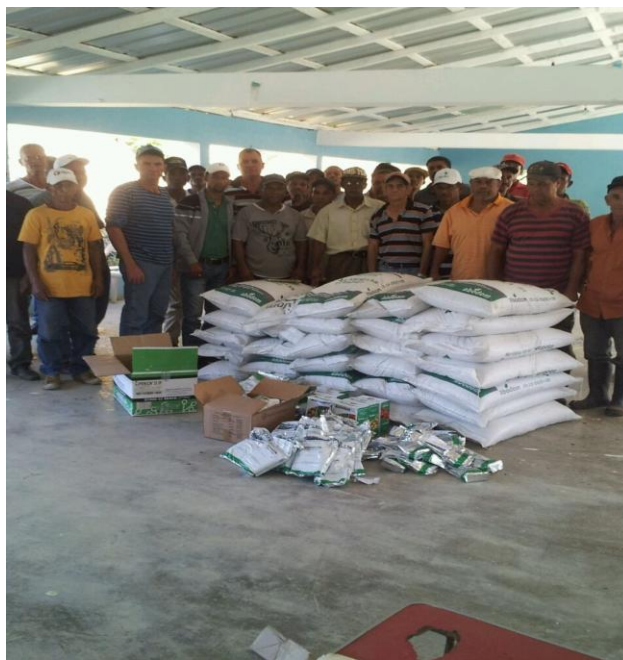
Entrega de insumos a productores del proyecto de tabaco Criollo

Nota: el valor del apoyo financiero a este proyecto se estima en RD$1,340.00 por tareas.