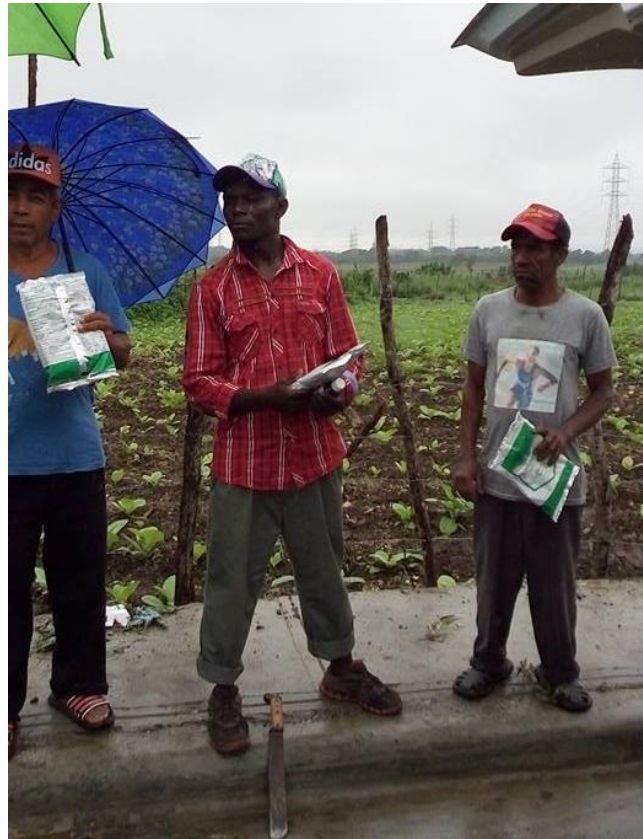
Entrega de insumos agrícolas a productores tabacaleros

Como el tabaco es un cultivo muy sensible al ataque de plagas y enfermedades que pueden, en cualquier momento, destruir las plantaciones y causar la pérdida total de la cosecha, mediante este programa se ayuda a los productores a disminuir este riesgo mediante la distribución de insumos agrícolas específicos para el cultivo.