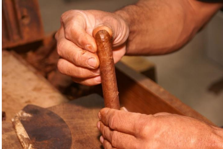
Elaboración de cigarrros hechos a mano en la Fábrica escuela