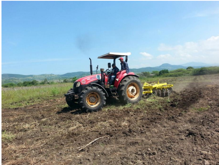
Labores de preparación de tierra para la siembra de tabaco

Las metas institucionales se plantean a través de los programas y servicios de apoyo directo a los productores que el INTABACO ejecuta en cada cosecha tabacalera. En cada programa se plantean las metas particulares cuya suma representa la meta final de la institución. A continuación se describen de forma resumida los principales programas y servicios ejecutados durante el 2017.