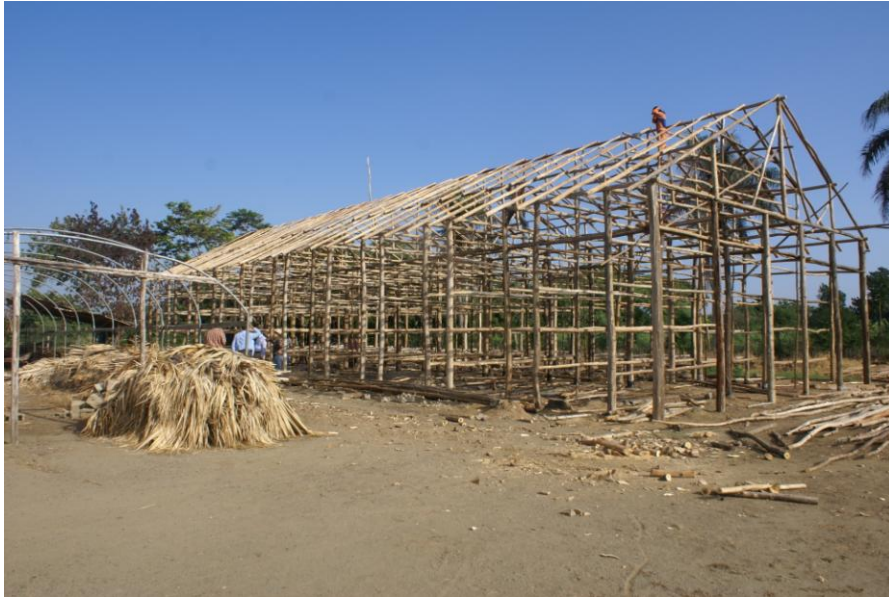
Casa de curado y estructuras de producción de plántulas en bandejas construidos para el del proyecto